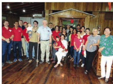
Festejo Día de la Madre

cioeconómico y cultural de Honduras y sus habitantes.