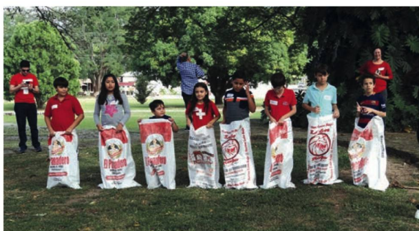
Fiesta de Navidad: carrera con sacos