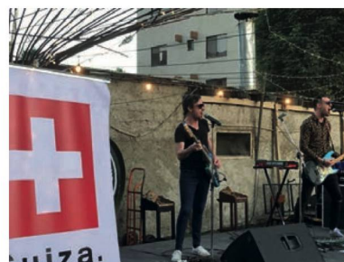
Imagen de la Feria "Pueblo de la Francofonía"