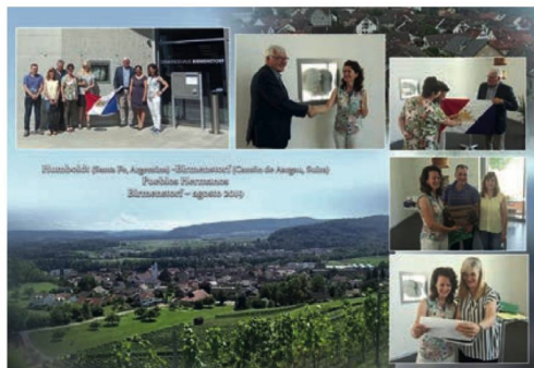
Birmenstorf 2019 y St. Nicklaus 2019