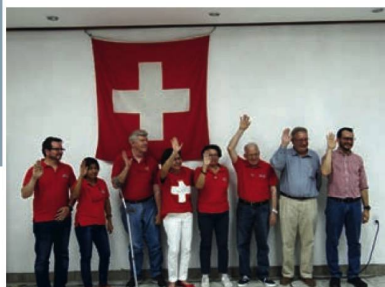
Nueva Junta Directiva electa para 2019-2020