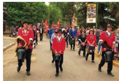
Fiesta Nacional de la Cerveza 2019

tanto desde Suiza, como locales, el 11 del 11 del 2011 se inauguró la casa propia.