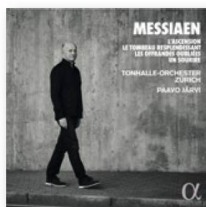
PAAVO JÄRVI: "Messiaen" Tonhalle-Orchester, Zürich Alpha 2019

¿Por qué Messiaen? Paavo Järvi había estado esperando esta pregunta. Con aire relajado, el nuevo director principal de la Orquesta de la Tonhalle de Zúrich responde: "Porque me encanta Olivier Messiaen. Su música es grandiosa y se toca muy poco. Vamos a lanzar una pequeña colección de sus obras maestras en CD".