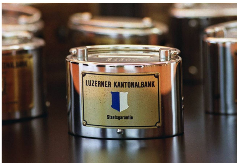
Durante generaciones, la nación suiza aprendió a ahorrar gracias a la alcancía. Hoy, al ubicarse las tasas de interés en su nivel histórico más bajo, este objeto se convierte en reliquia para museos.

Hipótesis 3: En vez de buscar formas de inversión alternativas, los ahorradores suizos sacan más dinero de sus cuentas y lo guardan debajo del colchón. Si bien no hay cifras nuevas que apoyen esta tesis, una encuesta del Banco Nacional Suizo, de 2017, aporta algunos indicios. Se interrogó a los suizos sobre los motivos por los que guardan su dinero en efectivo en casa o en otro lugar. El siete por ciento de los encuestados respondieron que lo hacen para ahorrar o por temor a los intereses negativos. Esto significa que el