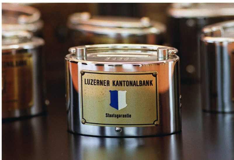
Durante generaciones, la nación suiza aprendió a ahorrar gracias a la alcancía. Hoy, al ubicarse las tasas de interés en su nivel histórico más bajo, este objeto se convierte en reliquia para museos.

Hipótesis 3: En vez de buscar formas de inversión alternativas, los ahorradores suizos sacan más dinero de sus cuentas y lo guardan debajo del colchón. Si bien no hay cifras nuevas que apoyen esta tesis, una encuesta del Banco Nacional Suizo, de 2017, aporta algunos indicios. Se interrogó a los suizos sobre los motivos por los que guardan su dinero en efectivo en casa o en otro lugar. El siete por ciento de los encuestados respondieron que lo hacen para ahorrar o por temor a los intereses negativos. Esto significa que el