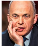
El Presidente de la Confederación, Ueli Maurer, debe apoyar un acuerdo marco muy cuestionado por la UDC, su propio partido.

El presente artículo refleja la información disponible al cierre de redacción, a principios de agosto. Artículos anteriores sobre este tema: www.ogy.de/CH-EU