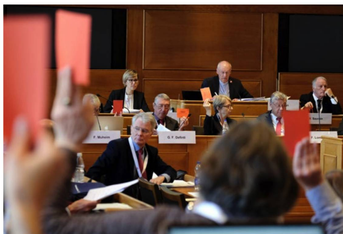
Entre los múltiples aspectos que abordó en Berna, el CSE se centró principalmente en el año electoral.

Por primera vez en su historia, el CSE decidió en Berna emitir recomendaciones de voto; eso con el fin de que la próxima legislatura tenga más en cuenta los deseos y necesidades de las suizas y suizos en el extranjero. En la siguiente sesión del CSE, que se celebrará el 16 de agosto de 2019 en Montreux, se tomarán decisiones concretas acerca de las recomendaciones de voto.