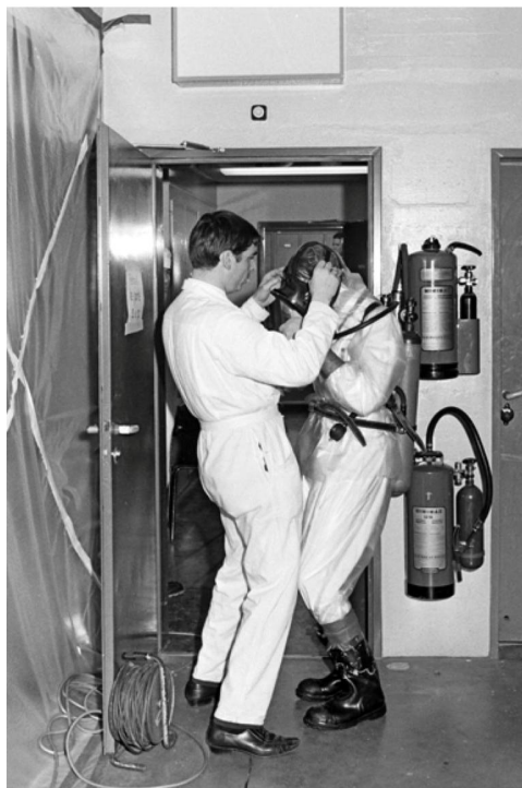
El pasillo que conduce al interior del reactor de Lucens, contaminado con radiactividad

Las fotografías, procedentes del expediente “Lucens” de la agencia de prensa SDA-Keystone, han sido publicadas este año por varios medios de comunicación suizos.