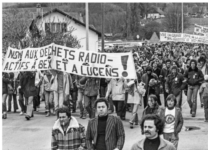
Tuvieron que pasar varios años para que Lucens se convirtiera en un sitio de manifestaciones antinucleares (1978)