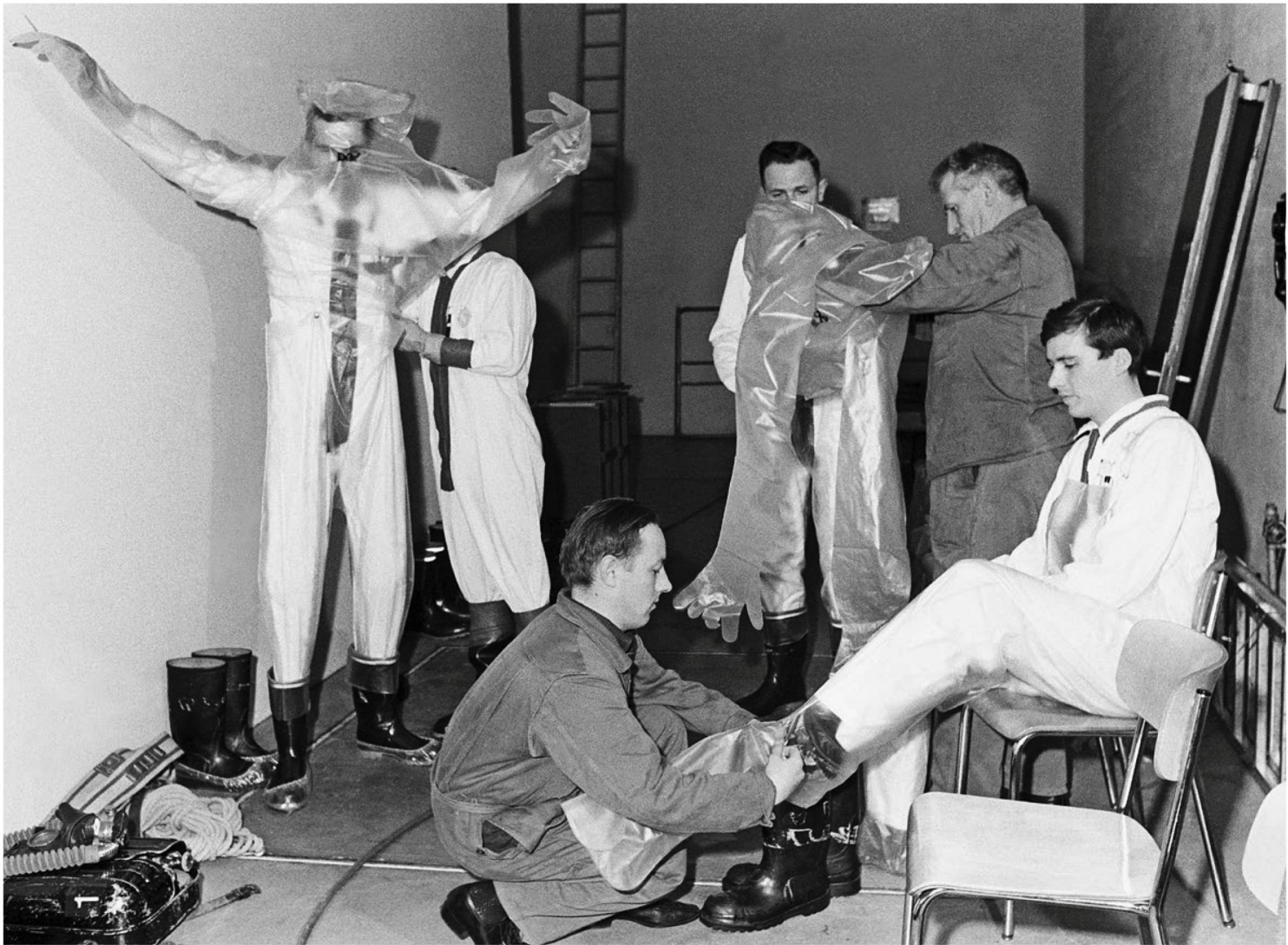
A poco de ocurrir el accidente, los técnicos visten su equipo de protección