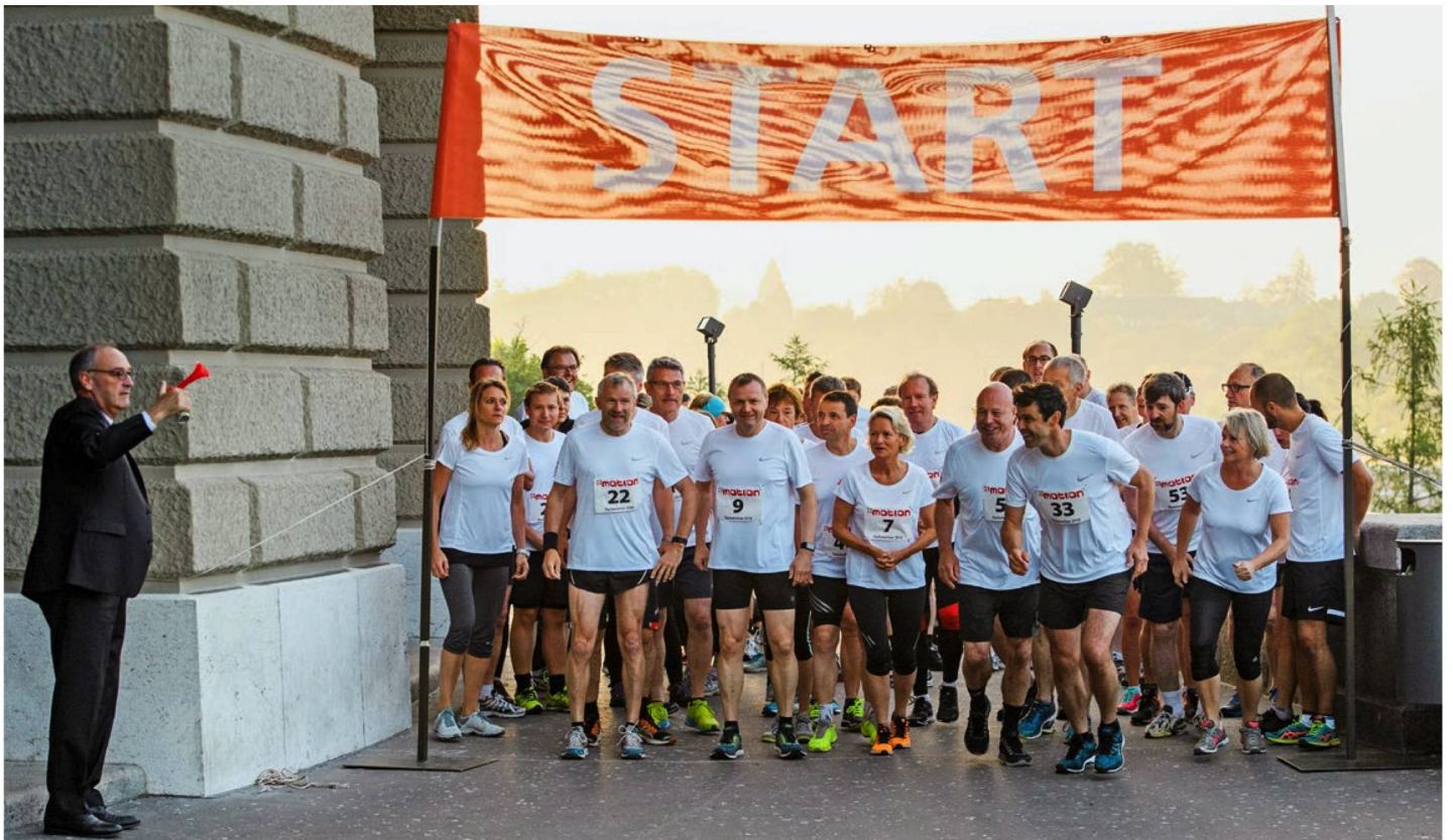
Cada año, los consejeros participan en la tradicional carrera alrededor del Palacio Federal; pero ahora inicia la carrera para ingresar al Palacio Federal.

Poco después de las elecciones de 2015, Guy Parmelin fue elegido por el Parlamento como segundo miembro de la UDC para formar parte del gobierno federal. De ese modo, los cuatro partidos principales volvieron a estar debidamente representados en el Consejo Federal (dos miembros de la UDC, dos del Partido Socialista Suizo, dos del Partido Liberal Radical, uno del Partido Demócrata Cristiano), poniendo fin por el momento a las disputas de los últimos años por los escaños en el Consejo Federal. Además, el giro a la derecha en las elecciones al Consejo Nacional no provocó una conmoción tan fuerte del panorama político como se había vaticinado. El bloque ciudadano obtuvo más votos en el Parlamento que antes y marcó el rumbo de la política financiera y social. Así, el Parlamento protegió el secreto bancario dentro del país y auto-