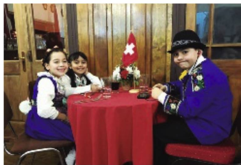
Los más pequeños de la fiesta con trajes típicos