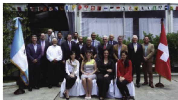
I Feria Comercial Suizo-Guatemalteca