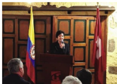
Celebración en el Club suizo de Bogotá