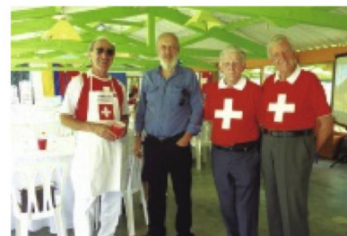
Celebración en Medellín