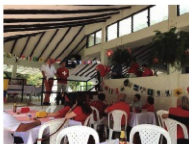
Celebración en Cali