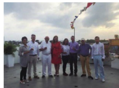
Fiesta nacional en Cartagena

(ANA MARÍA BAUTISTA-EMBAJADA DE SUIZA EN COLOMBIA)