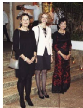
La Embajadora de Suiza en Colombia, Yvonne Baumann

Nacional Suiza en Colombia reunieron a miembros de la comunidad suiza en distintas ciudades del país, en eventos para reunirse en familia y compartir el orgullo de ser suizos.