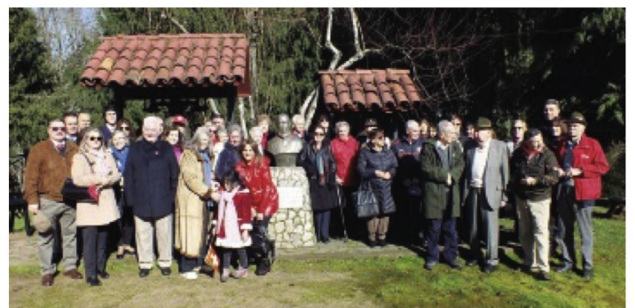
Fiesta Nacional Suiza en Traiguén