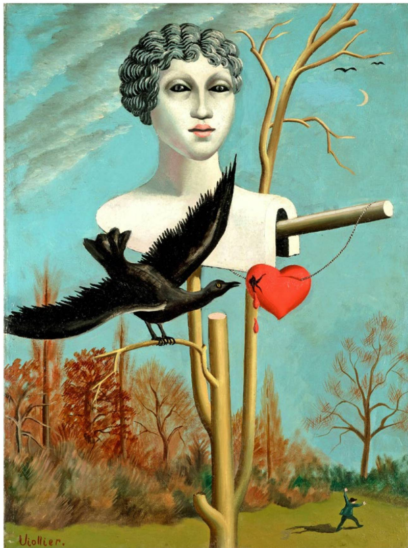
Jean Viollier L'épouvantail charmeur III, 1928 óleo sobre lienzo