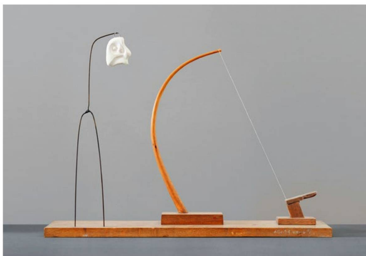
Alberto Giacometti Fleur en danger, 1932 madera, yeso, alambre y cordel