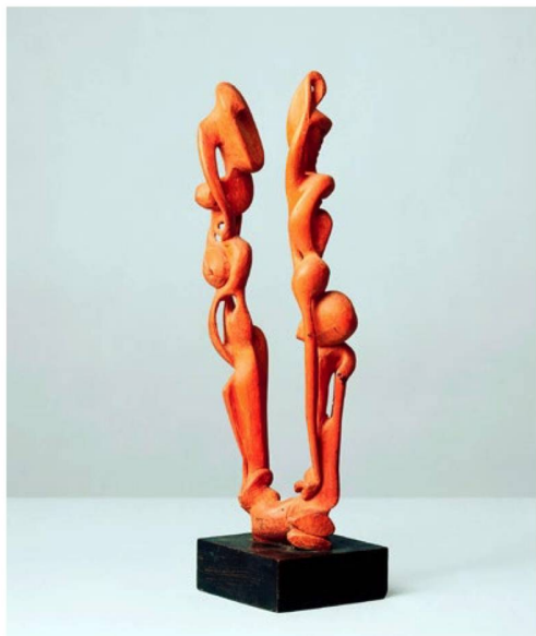
Serge Brignoni Érotique-végétal I, 1933 madera