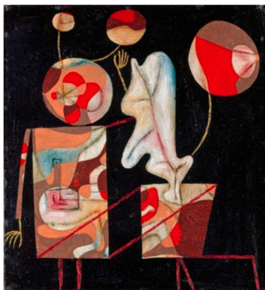
Paul Klee Marionetten 1930 óleo sobre lienzo