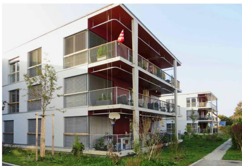
El complejo residencial de Brüggliäcker, en Schwamendingen, desarrollado por una cooperativa de construcción de viviendas, está situado junto a un barrio tradicional de casas unifamiliares.

Nicolas Bassand dedicó su doctorado al tema de la “profundidad” de la construcción. Este modo compacto de construir, inspirado en algunas construcciones medievales, se abandonó en el siglo XX, con lo que surgieron bloques de viviendas lineales y espaciados, acordes con las exigencias higienistas del urbanismo. Desde principios de siglo está de regreso en Suiza este concepto de profundidad, con construcciones más densas y anchas. El profesor de la HEPIA cita como ejemplo un inmueble del Schürliweg, en Affoltern (ZH), que presenta un espesor de 38 metros, o bien un bloque de edificios de 19 metros de profundidad, construido en el barrio de Hardturm, en Zurich-West, que integra apartamentos comunitarios de trece habitaciones.