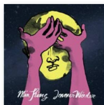
MIN KING: Immer Wieder (Una y otra vez), Irascible 2017.

Jamás se había visto esto: soul procedente de Suiza y, por si fuera poco, en dialecto. Y no se trata de algún sustituto de esa música de baile tan satinada como estéril que desde hace años figura con ese nombre en las listas de los superventas, sino de un soul auténtico, como el que surgió a finales de los años cincuenta a partir del rhythm'n'blues .