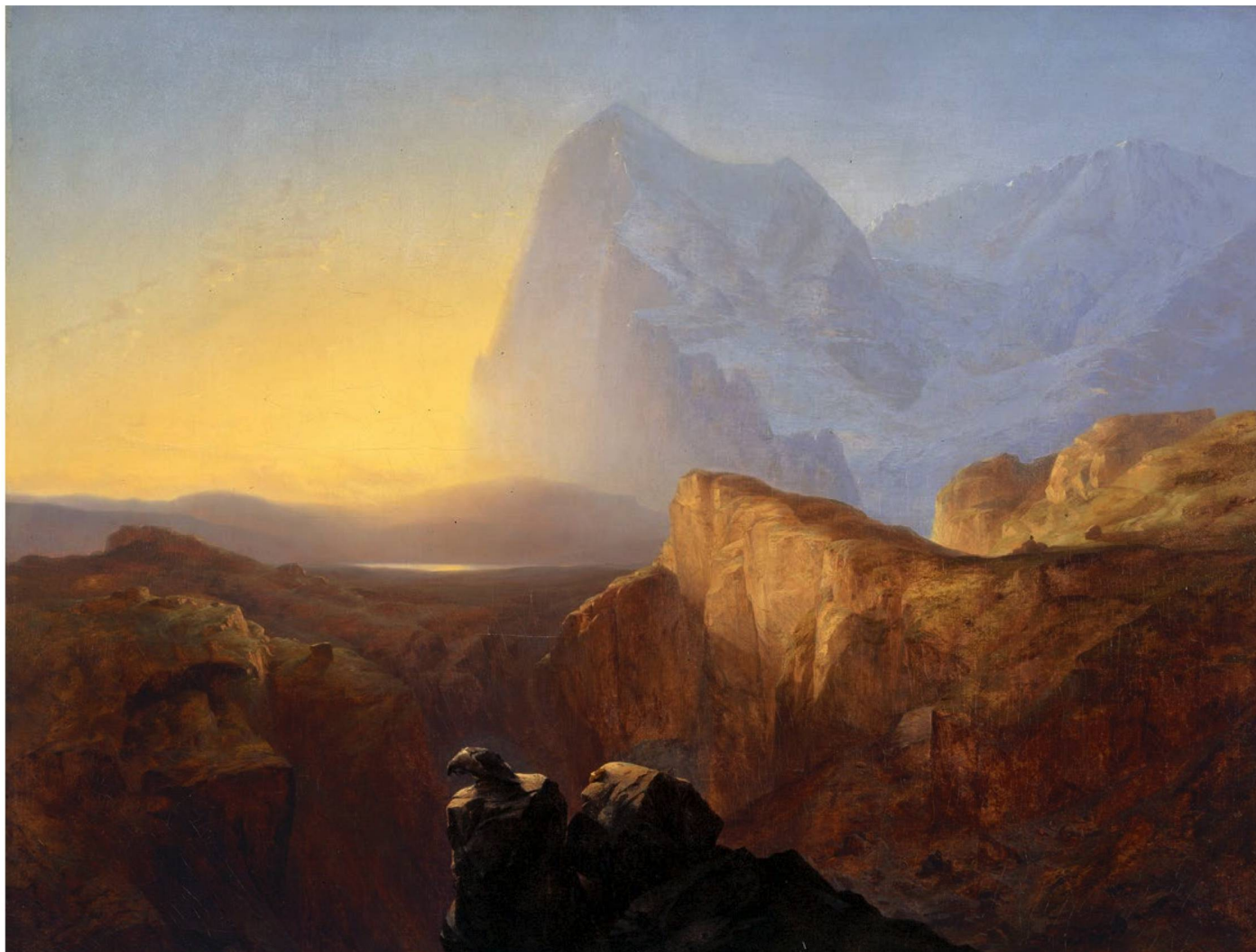
Alexandre Calame: Le Grand Eiger au soleil levant (El Gran Eiger al amanecer), 1844.