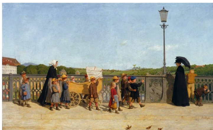
Albert Anker: Kleinkinderschule auf der Kirchenfeldbrücke (Escuela de párvulos en el puente Kirchenfeld), 1900.