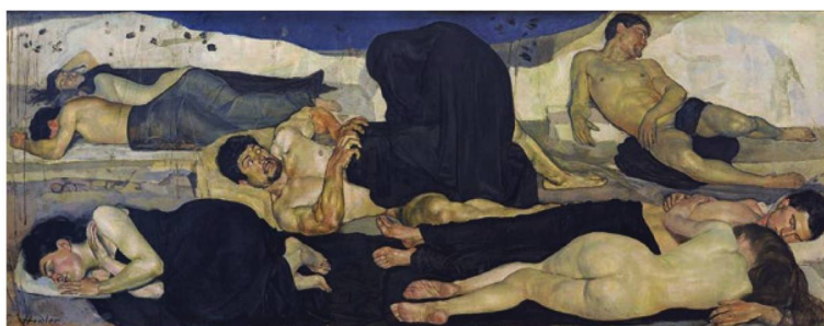
Ferdinand Hodler: Die Nacht (La noche), 1889.