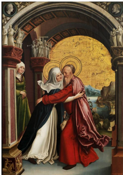
Niklaus Manuel: Altar der heiligen Anna: Begegnung von Joachim und Anna an der Goldenen Pforte (Altar de Santa Ana: encuentro de Joaquín y Ana ante la Puerta Dorada), 1515.