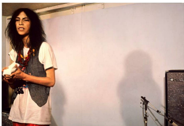
Franz Gertsch: Patti Smith II , 1978.