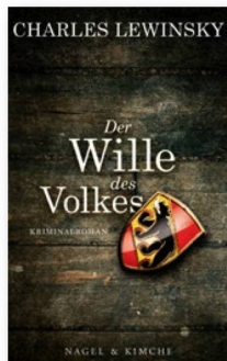
CHARLES LEWINSKY: DER WILLE DES VOLKES (LA VOLUNTAD DEL PUEBLO). Nagel & Kimche, 2017. 384 págs. aprox. 27,90 CHF, 24 EUR

Kurt Weilemann es un periodista jubilado chapado a la antigua: para él, la ética profesional exige una investigación minuciosa y el uso de un lenguaje correcto. Pero los tiempos han cambiado y nadie ya solicita sus servicios. Un día, Derendinger, un antiguo compañero, desea entrevistarse con él; pero se expresa de manera tan confusa que Weilemann concluye que está enfermo. Sin embargo, cuando Derendinger aparece muerto pocas horas después, Weilemann pronto deduce que no pudo tratarse de un suicidio, como se pretende oficialmente. Picado por la curiosidad, pero también animado por Eliza, una joven amiga del fallecido, empieza a investigar el caso y, en ese