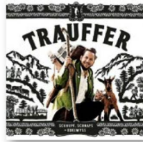
TRAUFFER: SCHNUPF, SCHNAPS + EDELWYSS . Ariola/Sony, 2018.

Empieza con pisadas de vacas que suben a los pastizales de verano, un mugido ocasional y algún cencerro; sigue un himnico canto a la tirolesa: no queda duda alguna sobre dónde está el paraíso para Trauffer: en las cumbres alpinas de esa Suiza de estampa, allí donde “sexo, drogas y rocanrol” nunca lograron desplazar a “ Schnupf, Schnaps + Edelwyss ” [“rapé, aguardiente y flor de las nieves”], que es también el título de su nuevo álbum.