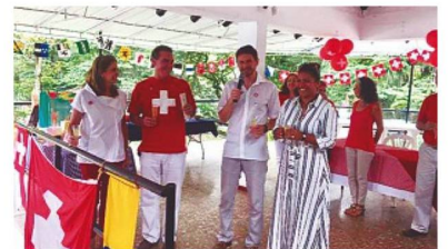
Festejo en Cali