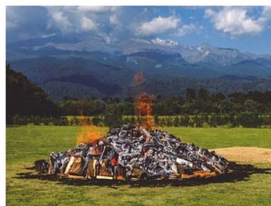
Tradicional fogata