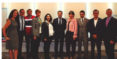
Evento sobre Inclusión Laboral y Diversidad LGBT+ en colaboración con Zurich México

traordinario Mariachi “Esto es México”. El final del festejo fue la extraordinaria fogata que tuvo como fondo, la vista de los nevados volcanes el Popocatepetl y la Ixtlaci-