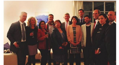
Festejo en Medellín