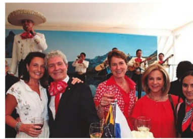
Celebración de la Fiesta Nacional de Suiza con Mariachis en la Residencia del Embajador Tournon