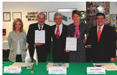
Firma del Convenio entre la SwissCham y la CONUEE en eficiencia energética