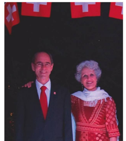
Embajador Kunz y su esposa Mónica

El pasado 1º de agosto la Residencia del Embajador de Suiza fue escenario de la celebración de la Fiesta Nacional Suiza, evento que reunió a más de 200 asistentes entre autoridades, representantes de empresas y de la Academia, del Cuerpo Diplomático, socios y amigos de la Confederación. Banderines, luces y decoración alusiva a Suiza hicieron de la noche bogotana un espacio cálido y lleno de alegría.