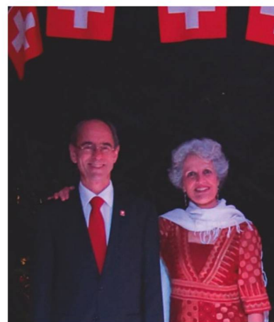
Embajador Kunz y su esposa Mónica

El pasado 1º de agosto la Residencia del Embajador de Suiza fue escenario de la celebración de la Fiesta Nacional Suiza, evento que reunió a más de 200 asistentes entre autoridades, representantes de empresas y de la Academia, del Cuerpo Diplomático, socios y amigos de la Confederación. Banderines, luces y decoración alusiva a Suiza hicieron de la noche bogotana un espacio cálido y lleno de alegría.