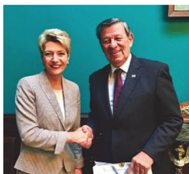
Senadora Karin Keller-Sutter y Canciller Uruguayo Rodolfo Nin Novoa

Si tiene problemas para acceder o si tiene preguntas sobre la ventanilla en línea del DFAE, diríjase por favor al Centro Consular Regional Buenos Aires.