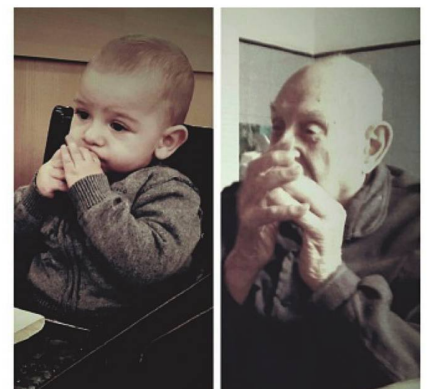
Herencia de genes: idéntico gesto

En este ámbito de esfuerzo y perseverancia creció don