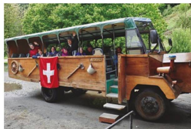
Recorrido del valle del río Peulla

El grupo caminó hacia una gran cascada y al día siguiente recorrimos parte del valle del río Peulla, en un camión transformado en bus. Todos fuimos capturados por la exquisita miel que otro suizo produce con la gran variedad de flores nativas del bosque, parte de un Parque Nacional. No fue po-