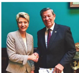
Senadora Karin Keller-Sutter y Cancellor Uruguayo Rodolfo Nin Novoa

Si tiene problemas para acceder o si tiene preguntas sobre la ventanilla en línea del DFAE, diríjase por favor al Centro Consular Regional Buenos Aires.