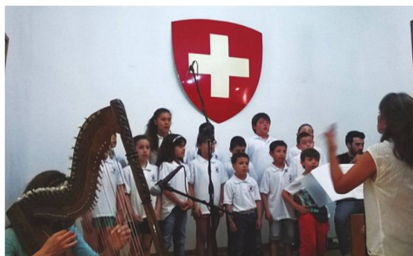
Coro de Niños Mundo Sonoro