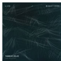
YANNICK DELEZ: "Live/Monotypes", Unit Records, 2017.

Yannick Delez es un pianista que toca música moderna inspirada en el jazz, pero que cautiva también a los amantes de la música clásica y la improvisación. Este artista de 44 años nacido en Martigny (Suiza occidental) pero que vive desde 2011 en Berlín, sorprende con un nuevo álbum doble en el que toca solo: "Live/Monotypes" es una obra llena de energía que cautiva una y otra vez.