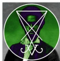
ZEAL & ARDOR: "Devil is Fine" (Radicalis).

Fue enorme el bombo publicitario en torno a este proyecto musical, ya antes de que existieran grabaciones. El músico basiliense Manuel Gagneux se preguntó cómo sonaría una mezcla de canciones de esclavos africanos y góspel junto con black metal, una mezcla hasta entonces inconcebible. Fue una broma, al la que Gagneux sin embargo se dedicó con ahínco.