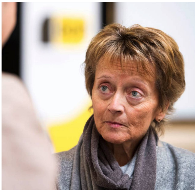
La ex Ministra de Finanzas, Eveline Widmer-Schlumpf, considerada la “madre” de la USR 3 –en la foto, durante una asamblea de delegados del PBD–, se mostró extremadamente crítica ante el proyecto de ley fiscal, tres semanas antes de los comicios.

La izquierda salió victoriosa de la enconada disputa electoral: el proyecto de ley fue rechazado con un 59,1% de los votos en contra: un resultado que