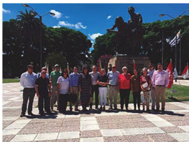
Delegación suiza y autoridades locales en la Plaza de los Fundadores