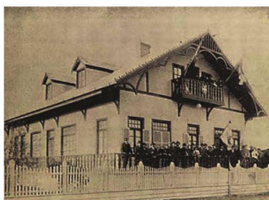
Círculo Suizo ayer y hoy