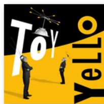
YELLO: «Toy», Universal Music.

Seamos sinceros: nadie esperaba que Yello se atreviera a introducir cambios radicales en su 13.º álbum. Dieter Meier y Boris Blank se mueven desde finales de los años 70 en su propio cosmos musical; desde hace mucho tiempo ya han desarrollado un sonido que ha influido a generaciones de músicos electrónicos y es mucho más que una simple marca o un simple sello. Combinado con su extravagante lenguaje visual, constituye una