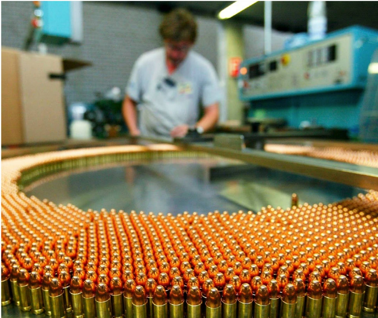
Las exportaciones de armas suizas se encuentran inmersas en un campo de tensión entre la economía, la ética y la moral. En la foto: control de cartuchos de 9 milímetros en el departamento de municiones de Ruag.

Las exportaciones de armas son un tema político de permanente actualidad en Suiza. El conflicto de Yemen ha venido a reavivar el debate y ahora somete al Consejo Federal a una fuerte presión. Presentamos a continuación un balance de la situación actual.