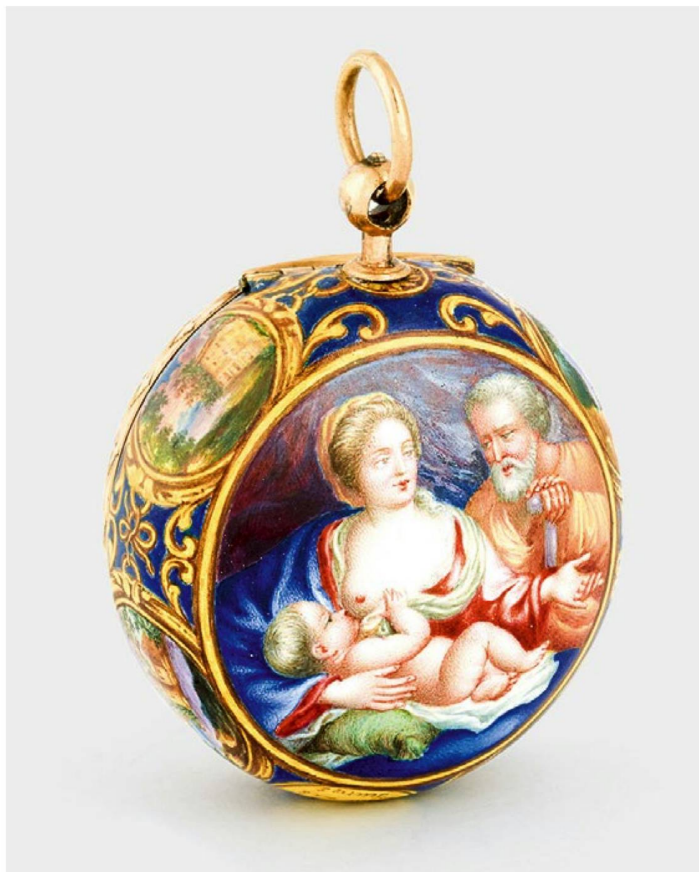
Este multicolor reloj de esmalte dorado fue fabricado por tres relojeros al mismo tiempo –en torno a 1745.