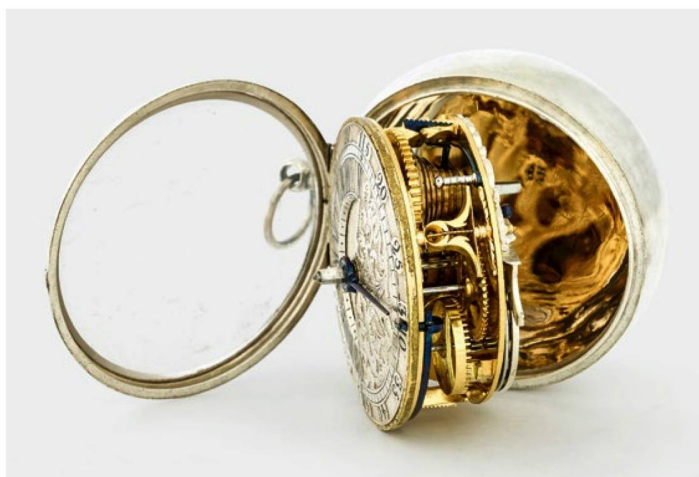
Reloj de bolsillo en plata, elaborado en torno a 1700 por Michel Spleiss de Schaffhausen y Domaine Dassier de Ginebra.