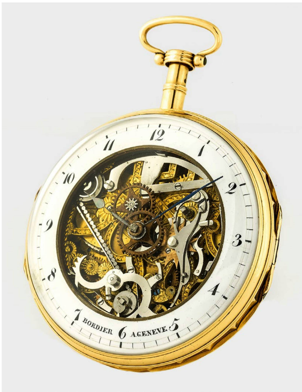
Reloj de bolsillo con "esqueleto" visible, fabricado en torno a 1820, diseñado por Bordier en Ginebra.