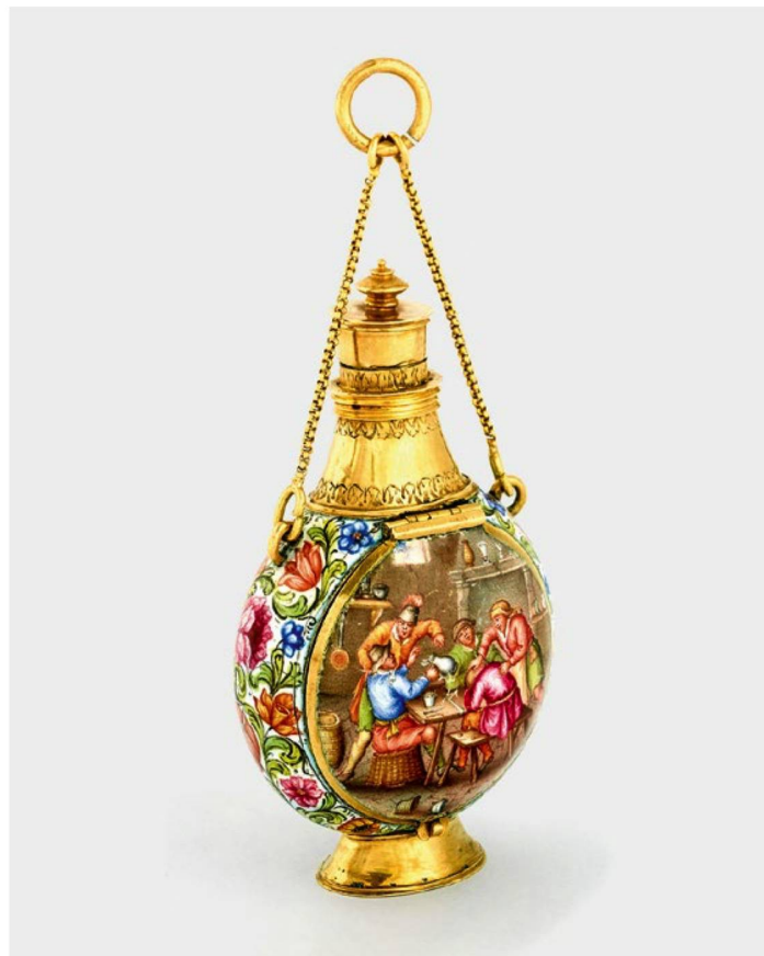
Reloj de esmalte dorado en forma de frasco para perfumes, fabricado en torno al 1665 por Auguste Bretonneau.