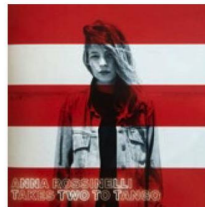
ANNA ROSSINELLI: "Takes Two To Tango", Universal Music.

Anna Rossinelli causó revuelo al anunciar su nuevo proyecto: haría una gira de tres meses por EE.UU. con su banda, y allí investigaría sobre las raíces de la música rock, se dejaría inspirar por los gospel y los blues, y finalmente se dirigiría al estudio de Nueva York para inmortalizar el resultado de sus vivencias en un documental y un álbum.