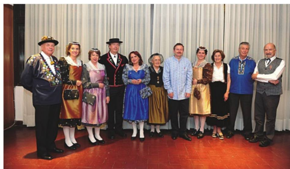
Asistentes al festejo con trajes típicos suizos

Todas las actividades propuestas resultaron muy motivadoras para los socios que participaron con entusiasmo. La Cena Aniversario se realizó en el Club que lució renovado, con un excelente menú de comida suiza y música en