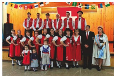
Ballet de la Asociación Helvetia de Línea Cuchilla, Embajador de Suiza, reina nacional del Folclore Suizo 2015

El Sr. Hans Peter Mock, Embajador de Suiza en Argentina, la reina nacional del Folclore Suizo 2015, autoridades locales, suizos de la Provincia de Misiones y el grupo de danzas suizas de la Asociación Helvetia de Línea Cuchilla.