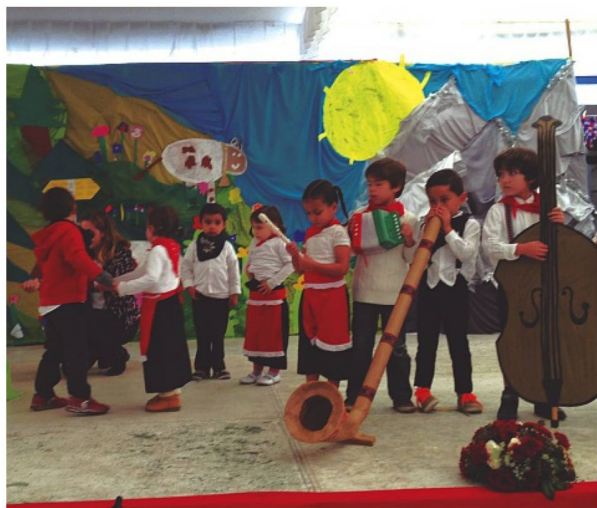
Actuación de los más pequeños del Colegio Suizo