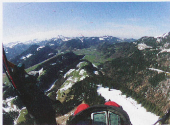
Parapentista en Alpstein

¿Quiere usted volar en Suiza? Nada más sencillo, porque el país está repleto de escuelas de vuelo, de clubs y de pilotos comerciales. Un día de prueba con un vuelo de 10 metros cuesta 120 francos, indica la FSVL. Para poder volar en parapente se necesita un carnet de vuelo, que en general se consigue en un año, y la idea es poder volar en varios tipos de condiciones meteorológicas, según esta federación. La formación cuesta unos 1800 francos y el material completo cerca de 5000 francos. Está prohibido volar sin carnet de vuelo, y la formación suiza es "detallada y cuidadosa", afirma Christian Jöhr.