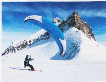
El speed flying sólo está permitido en pocos lugares