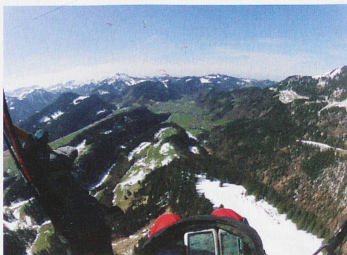
Parapentista en Alpstein

¿Quiere usted volar en Suiza? Nada más sencillo, porque el país está repleto de escuelas de vuelo, de clubs y de pilotos comerciales. Un día de prueba con un vuelo de 10 metros cuesta 120 francos, indica la FSVL. Para poder volar en parapente se necesita un carnet de vuelo, que en general se consigue en un año, y la idea es poder volar en varios tipos de condiciones meteorológicas, según esta federación. La formación cuesta unos 1800 francos y el material completo cerca de 5000 francos. Está prohibido volar sin carnet de vuelo, y la formación suiza es "detallada y cuidadosa", afirma Christian Jöhr.