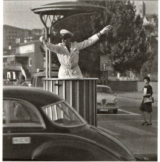
Policía de tráfico en Zúrich, fotografiado en torno a 1960