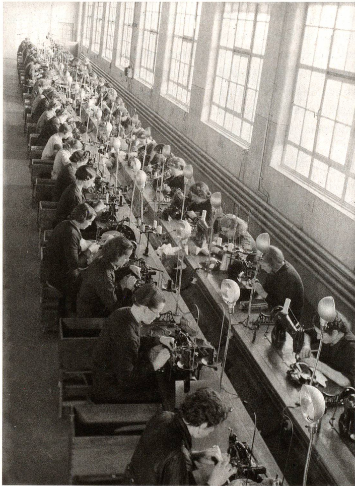
Costureras, fotografiadas en torno a 1940