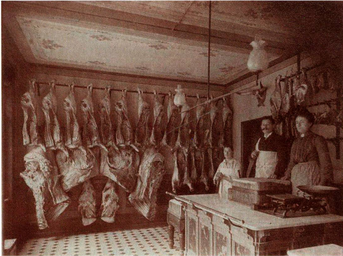
El personal de la carnicería Levy en Basilea, fotografiado entre 1890 y 1910

patrones y trabajadores. El Museo Nacional Suizo de Zúrich muestra actualmente fotografías sobre el trabajo, tomadas entre 1860 y 2015, que documentan de manera muy sugestiva los cambios en el mundo laboral y en la relación de los seres humanos con su trabajo.