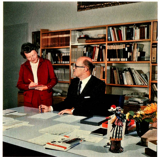
Director del Museo Nacional Suizo de Zúrich con su secretaria, fotografiados en torno a 1975