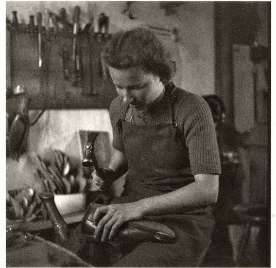
La primera zapatera de Suiza, fotografiada en 1944 en Lachen