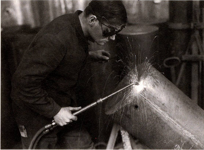
Soldadores, fotografiados en torno a 1940 en Frauenfeld

La exposición del Museo Nacional de Zúrich estará abierta hasta el 31 de enero de 2016. Sobre esta exposición se ha publicado un libro en la editorial Limmat, titulado "Arbeit - le travail", de 224 páginas con varios textos y 218 fotografías; CHF 48.-, Euro 52. www.limmatverlag.ch , www.nationalmuseum.ch