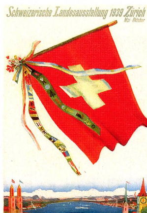
Cartel para la Exposición Nacional de 1939, celebrada en Zúrich