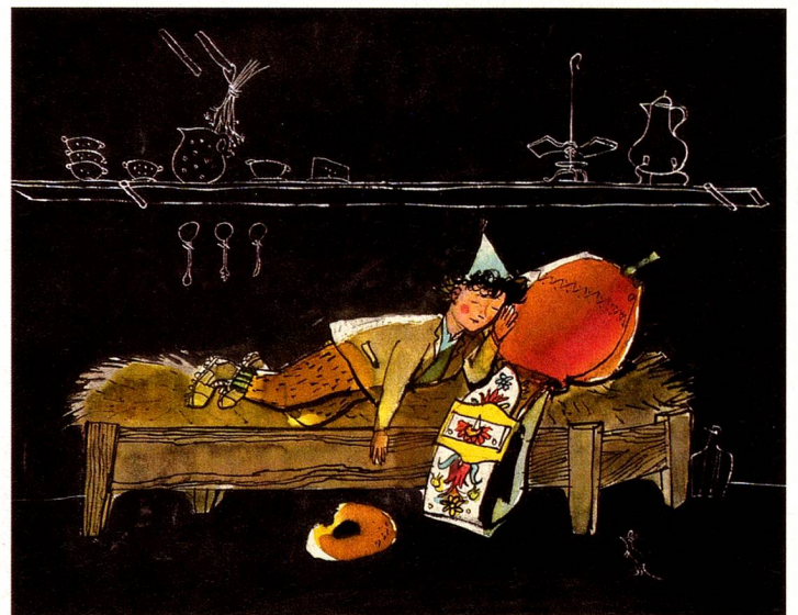
Ilustración de “Schellen-Ursli”