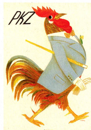
Cartel para PKZ (1935)