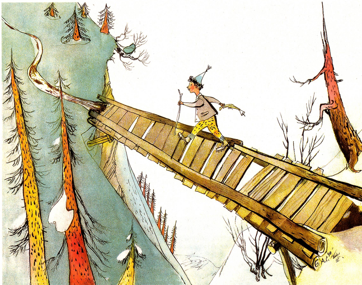
Schellen-Ursli de camino a la cabaña alpina