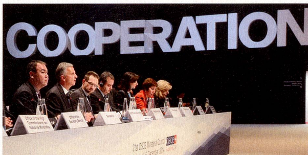
Sala del Consejo Ministerial, mesa principal

Para más información sobre la presidencia suiza de la OSCE en 2014, véase el dossier web: https://www.eda.admin.ch/eda/de/home/aktuell/dossiers/osze-vorsitz-2014.html