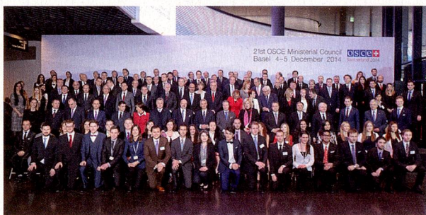
Foto de grupo