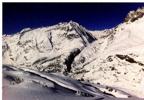
Aletscharena en la estación de esquí Bettmeralp, Valais

Italiano: www.admin.ch/opc/it/federal-gazette/2014/6213.pdf