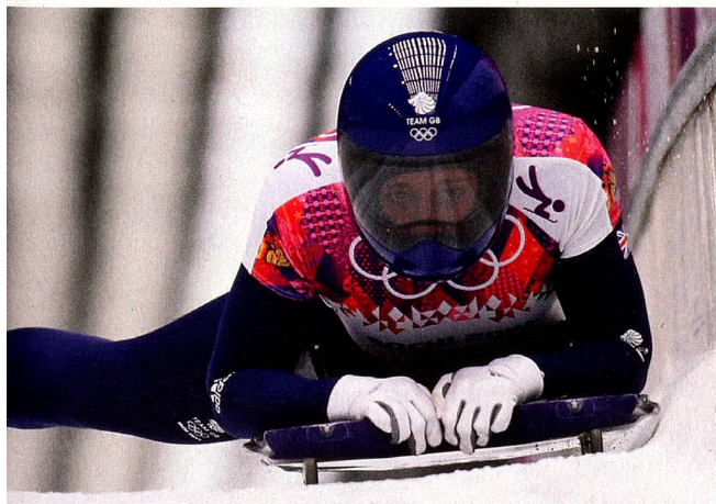
Oímpicos de Sochi: la ganadora de la medalla de oro, Elizabeth Yarnold (GB)

Los descensos en trineo, divertidos para grandes y pequeños, son fuertemente promovidos por las estaciones de esquí y los ferrocarriles de montaña