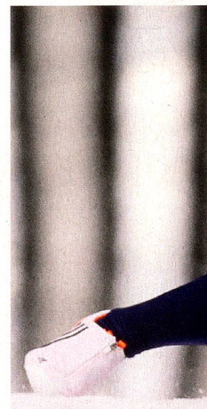
El skeleton en los Juegos

Es más fácil aprender a pilotar que a empujar, lo que explica que haya tantos atletas de sprint que practican este deporte. Pero al principio hay que trabajar mucho. Una vez en la pista lo que cuenta es tranquilizarse rápidamente para mantener la precisión. Lo que cuenta es la actitud mental, ya que cuanto más nervioso se pone quien