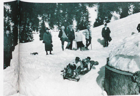
Salvaje carrera de trineos en Crans-Montana