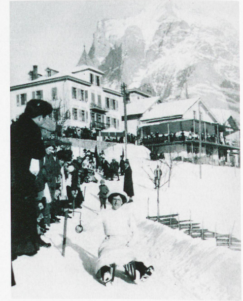
Carrera de trineos Village Run en Grindelwald