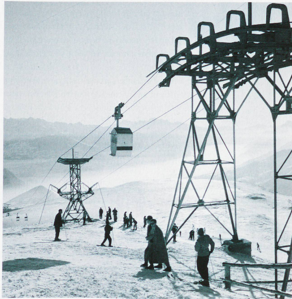
Primer teleférico de Suiza en Crans-Montana, 1950