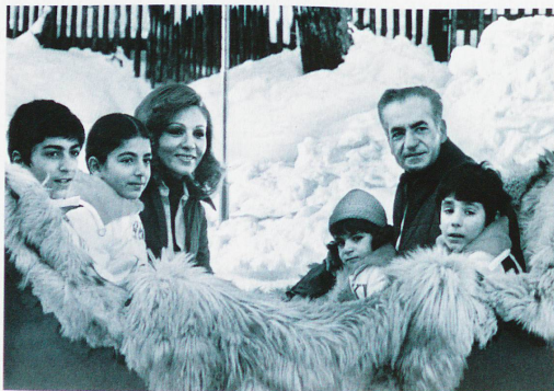
El Sha de Persia con su familia en St. Moritz, 1975