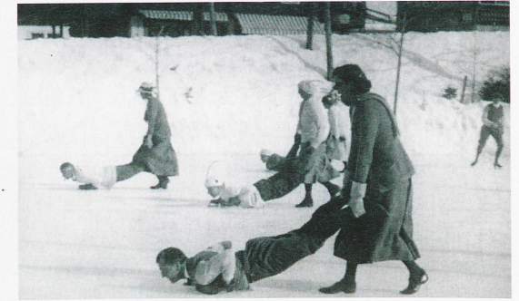
Juegos de hielo (Gymkhanas) en Grindelwald