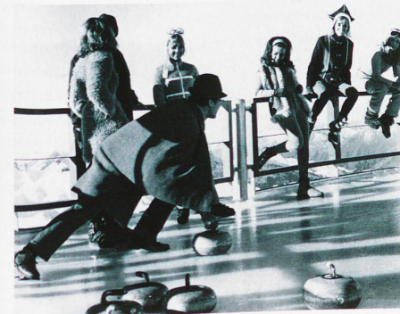
James Bond practicando el curling, 1968