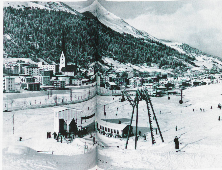
El remonte de Bolgen, en Davos, fue el primer telesquí del mundo, foto del invierno de 1934-1935