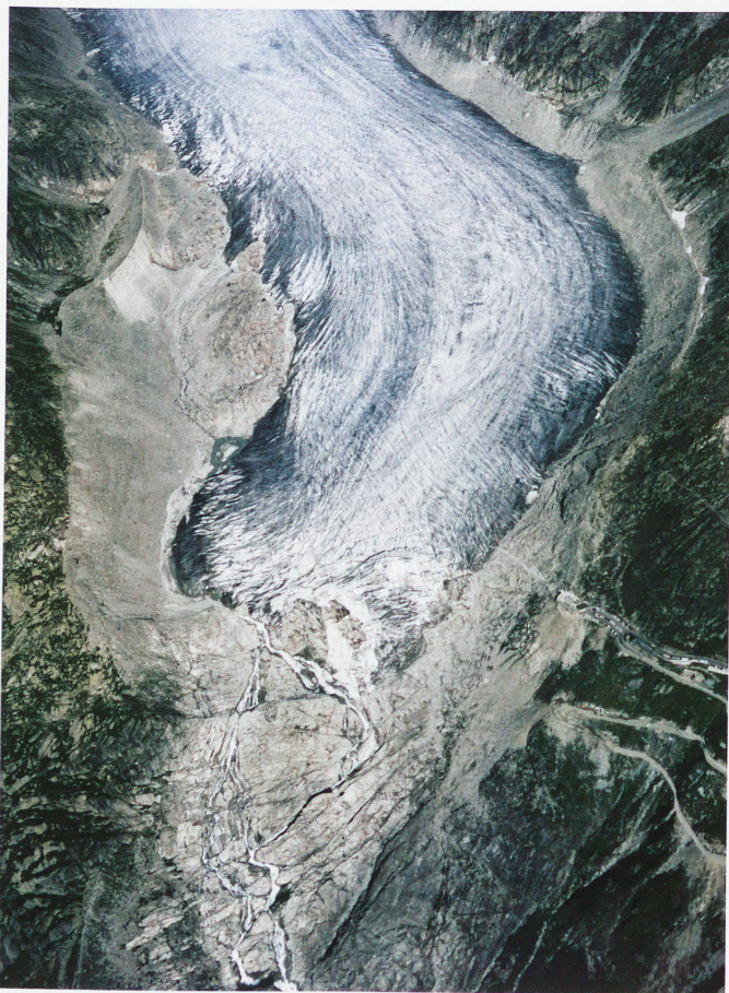
Lengua del glaciar del Ródano y carretera del puerto del Furka, septiembre de 1973