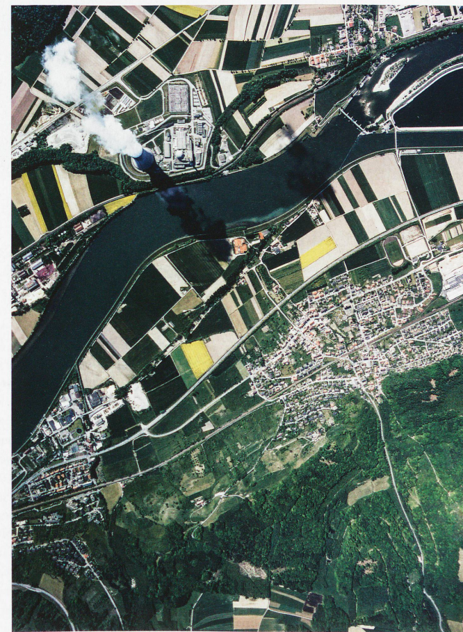
El río Aare y la central nuclear de Leibstadt, 1991