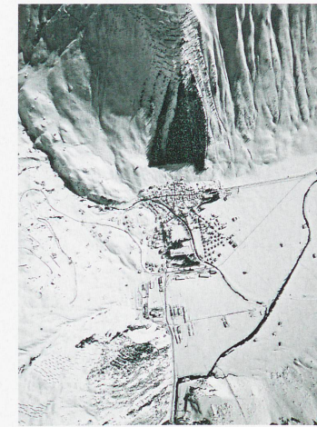
Bannwald, Andermatt, 1968