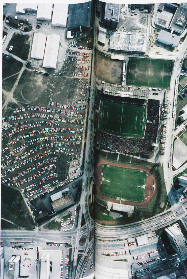
Final de la Copa, el lunes de Pascua, en el estadio de Berna, 1973