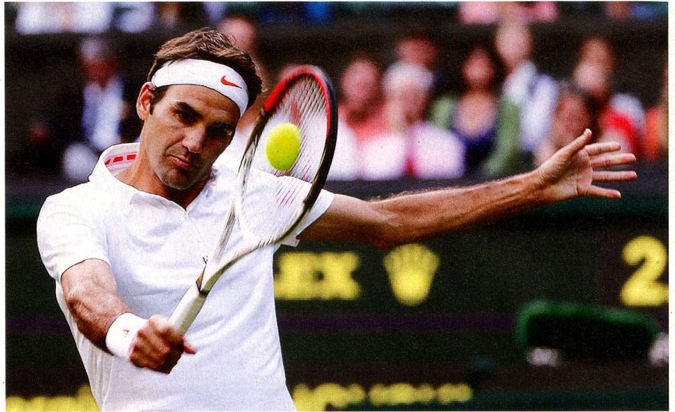
Roger Federer en Wimbledon, 2013

A la hora de elegir a sus patrocinadores, Roger Federer quiere asegurarse, como es típico en él, que exista un equilibrio. De los diez proveedores y patrocinadores — dejando aparte a las marcas internacionales Rolex y Credit Suisse — tres son de Suiza: Lindt, la compañía de seguros Nationale Suisse, así como el fabricante de electrodomésticos Jura. La pregunta de si un fabricante de planchas no será un socio demasiado simple para alguien de la categoría de