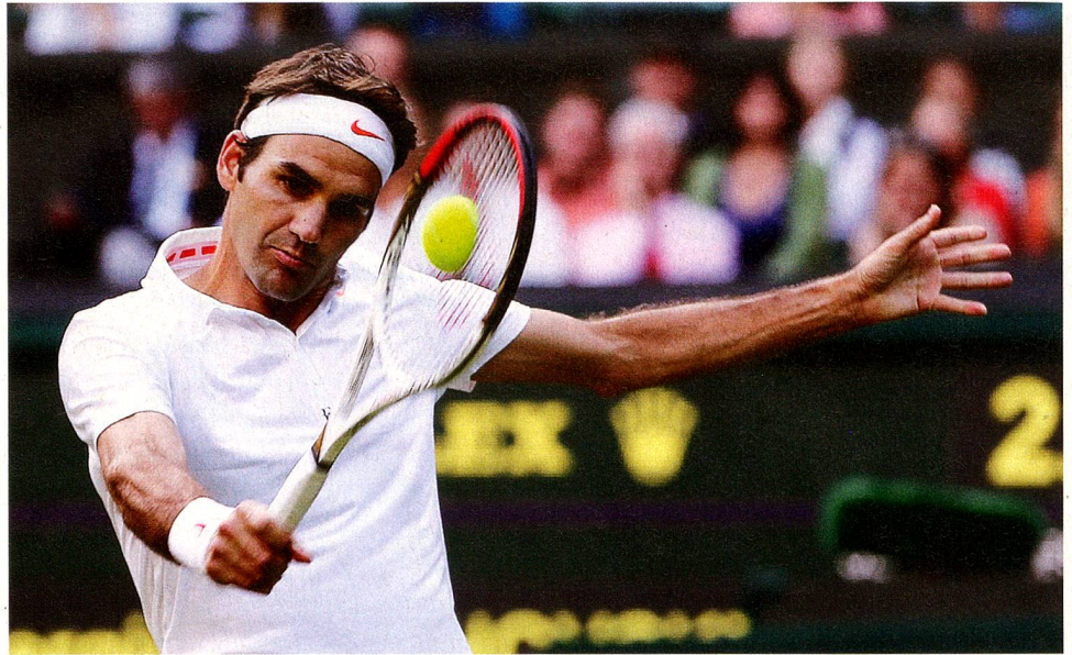
Roger Federer en Wimbledon, 2013

A la hora de elegir a sus patrocinadores, Roger Federer quiere asegurarse, como es típico en él, que exista un equilibrio. De los diez proveedores y patrocinadores — dejando aparte a las marcas internacionales Rolex y Credit Suisse — tres son de Suiza: Lindt, la compañía de seguros Nationale Suisse, así como el fabricante de electrodomésticos Jura. La pregunta de si un fabricante de planchas no será un socio demasiado simple para alguien de la categoría de