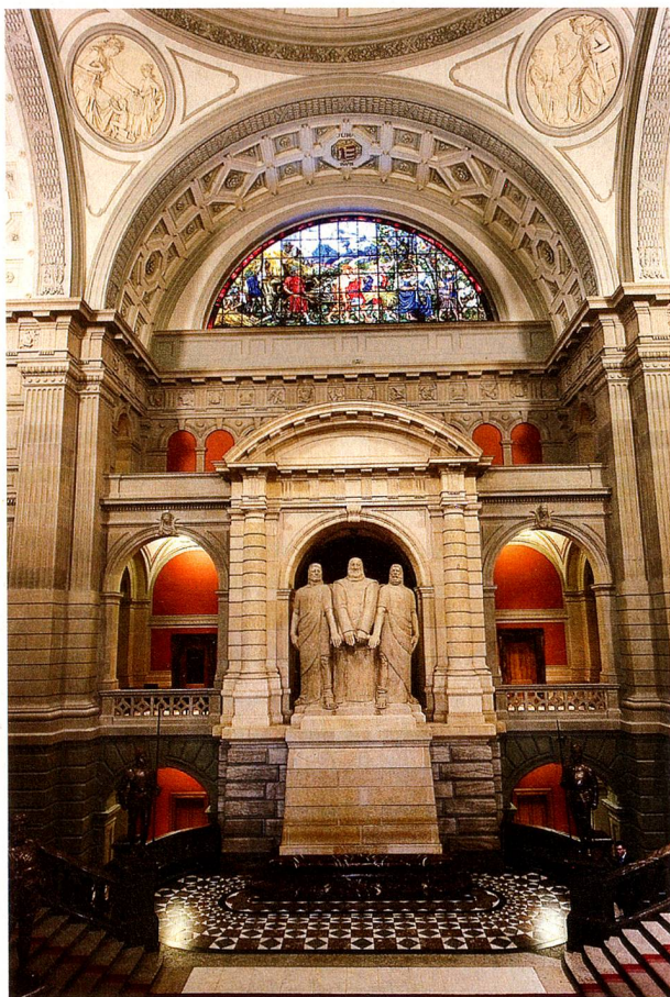
Los tres confederados en el vestíbulo del Palacio Federal

de representaciones, a las que correspondía una importante función integrativa para el nacimiento de una conciencia propia como confederación y su correspondiente legitimación." A este "complejo de idearios" pertenece asimismo el Rütli.