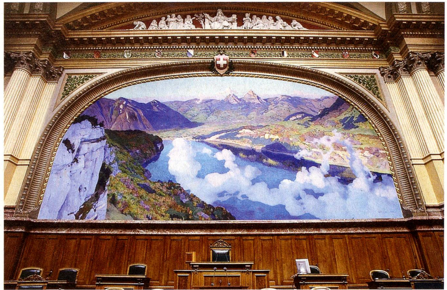
Mural de Charles Giron en la sala del Consejo Nacional, con el lago de los Cuatro Cantones, la pradera del Rütli y los mitos al fondo. En las nubes flota una figura de mujer desnuda con un ramo de olivo dorado, el símbolo de la paz, en la mano.

Y si antes por lo general en el Rütli sólo se celebraban sencillas fiestas federales, últimamente también los consejeros federales utilizan ese consagrado lugar para pronunciar discursos. Dos veces, en 2000 y 2005, los discursos de consejeros federales fueron masivamente interrumpidos por neonazis. En 2007, la Alliance F, la unión de organizaciones suizas de mujeres, marcó una nueva