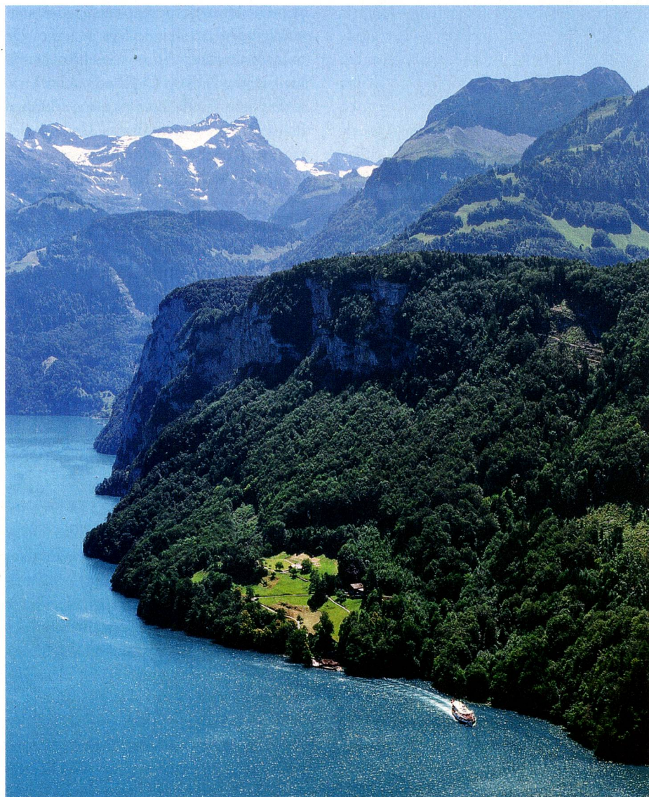
El Rütli en el lago de los Cuatro Cantones, en el cantón de Uri

Fue un encuentro al amparo de la noche, cuando los tres confederados acudieron en 1291 a la cita en el Rütli para hacer el juramento federal. Un encuentro así ya no sería tan fácil hoy; habría que solicitar un permiso y los tres gallardos hombres sólo podrían acometer su empeño durante el día, porque no está permitido pasar la noche en la famosa pradera del bosque que domina el lago de Uri. Y para cosas tan explosivas como un juramento federal hoy en día hay que presentar una “solicitud completa”, conforme