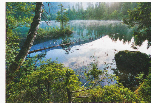
Lago de Cresta en Flims, cantón de los Grisones