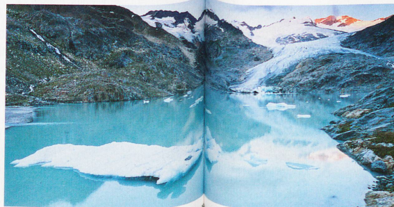
Glaciar Gauli, en el cantón de Berna, y el lago de Brienzen al fondo, al amanecer