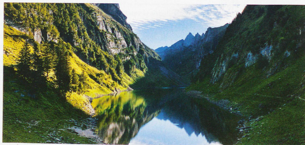
Lago de Fählen en el cantón de Appenzell Rodas Interiores, con la cumbre Altmann al fondo