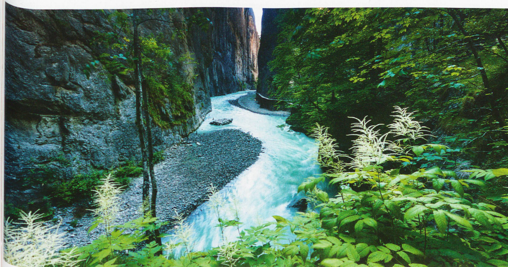
Desfiladero del Aare entre Meiringen e Innertkirchen, en el cantón de Berna