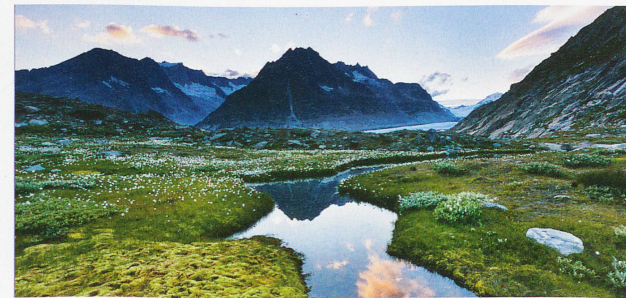
El afluente del lago Märjelen, al extremo del gran glaciar del Aletsch, en el cantón del Valais