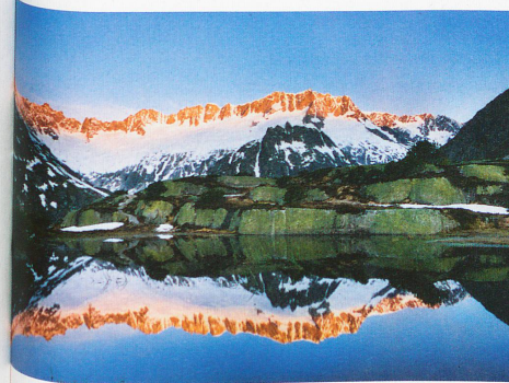
Pasto alpino de Göschenen en el cantón de Uri, con las cimas de la cadena montañosa Damma al fondo