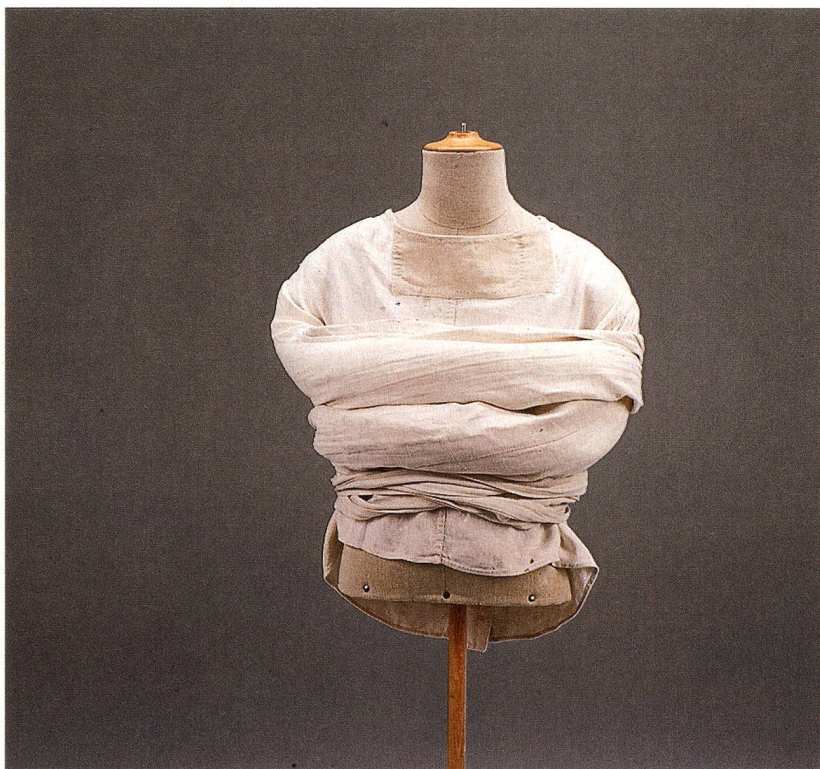
Camisa de fuerza de la clínica psiquiátrica de Waldau, cerca de Berna