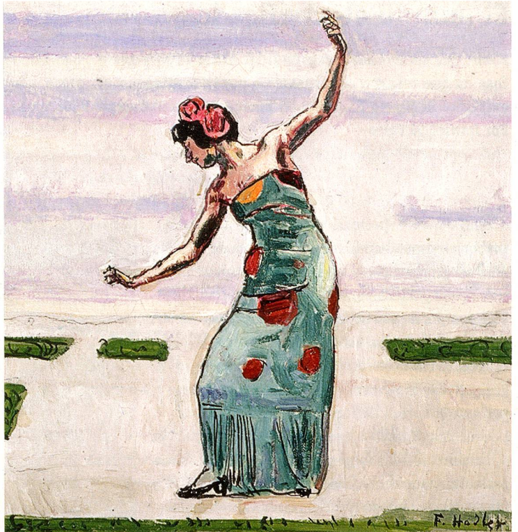
Típica obra de arte de aquella época: la «Tänzerin» (bailarina) de Ferdinand Hodler

que tuvo una gran acogida. Es una historia de la cultura de los años anteriores a la Primera Guerra Mundial, tan gráfica como opulenta, que sirvió de modelo para la exposición en Zúrich. Quien no haya leído el libro, ahora podrá, por así decirlo, recorrerlo. Y quien no puede ir a Zúrich, hace, como lector, la misma experiencia: contempla una mezcla densa y colorida, poco convencional y singular de impresiones de una época turbulenta, difícilmente abarcable y por eso mismo fascinante.