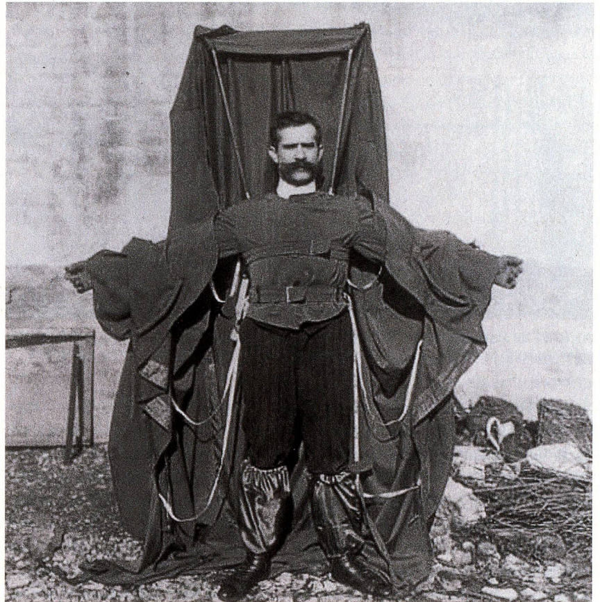
Franz Reichelt vestido de aviador – murió tras precipitarse al vacío el 4 de febrero de 1912 desde la Torre Eiffel

Al fondo de la exposición del Museo Nacional Suizo (Landesmuseum) de Zúrich hay una hélice quebrada colgada, que pertenecía al monoplano del pionero de la aviación, Theodor Borer, de Soleura, que el 22 de marzo de 1914, durante una exhibición aérea en Basilea, pereció durante una maniobra de vuelo en picado. Se le había advertido del pe-