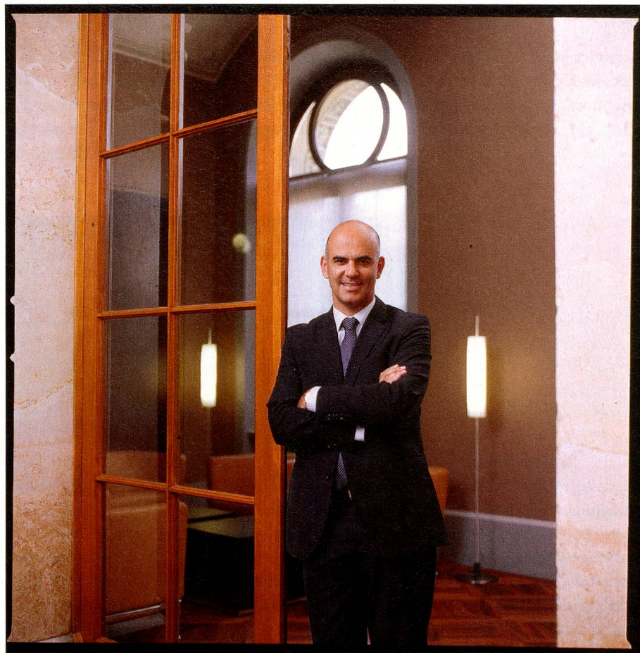
Alain Berset actúa sin plan alternativo, pues las últimas reformas fracasaron justamente por contar con uno

dría hacer? La admiración por este estratega es tan grande que los periodistas cuentan hasta sus fracasos como triunfos.