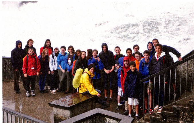
Jóvenes suizos del extranjero durante su viaje por Suiza en el verano de 2013