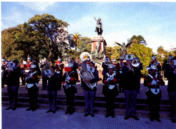
Bandas Militares de Suiza y Argentina unidas en la interpretación de un tango