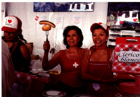
Venta de salchichas en el stand de Suiza

tés (1562) a la Corona Española que lo adquirió para construir la administración del Virreinato de la Nueva España.