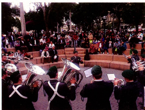
Banda Militar Suizo en el anfiteatro de la Plaza Central de Miraflores