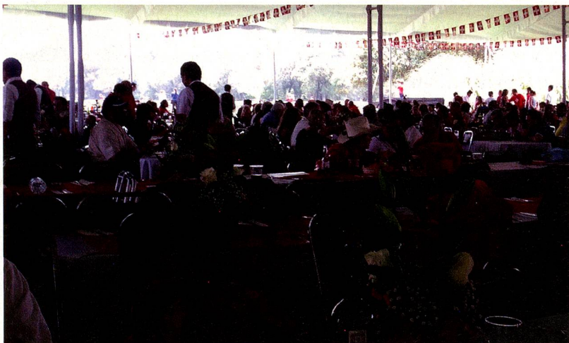
Vista general de los asistentes

Asistieron 1027 personas entre suizos y mexicanos, familiares y amigos; se degustaron salchichas schübling, ensaladas de papa, y diversos platillos suizos y mexicanos, acompañados por vino, cerveza, refrescos y café.