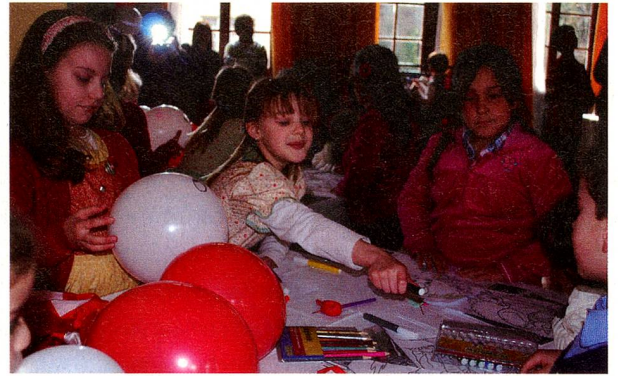
Los niños: el futuro del Club Suizo

suizos establecidos en la región desde hace ya largo tiempo y a los nuevos inmigrantes a ingresar al Club Suizo de Osorno donde no solo encontrará cordiales reuniones, sino también ayuda y apoyo durante los primeros pasos en el hermoso sur chileno.