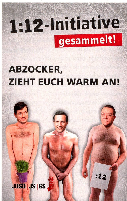
Los jóvenes socialistas (Juso) no se arredran a la hora de acusar públicamente a gente como Brady Dougan, Daniel Vasella y Marcel Ospel, a los que consideran «desplumadores». A raíz de ello, Vasella ha demandado al Juso.

Ambos frentes políticos sólo están de acuerdo en un punto: en 2013 Suiza está inmersa en un acalorado debate sobre la distribución. Y así se observa un rearme argumentativo, corroborado por estadísticas, diametralmente distinto según las magnitudes comparadas y el contexto político. La izquierda vaticina un creciente abismo entre los ingresos y el patrimonio de pudientes y menos pudientes, para las asociaciones económicas y los conservadores es justa-