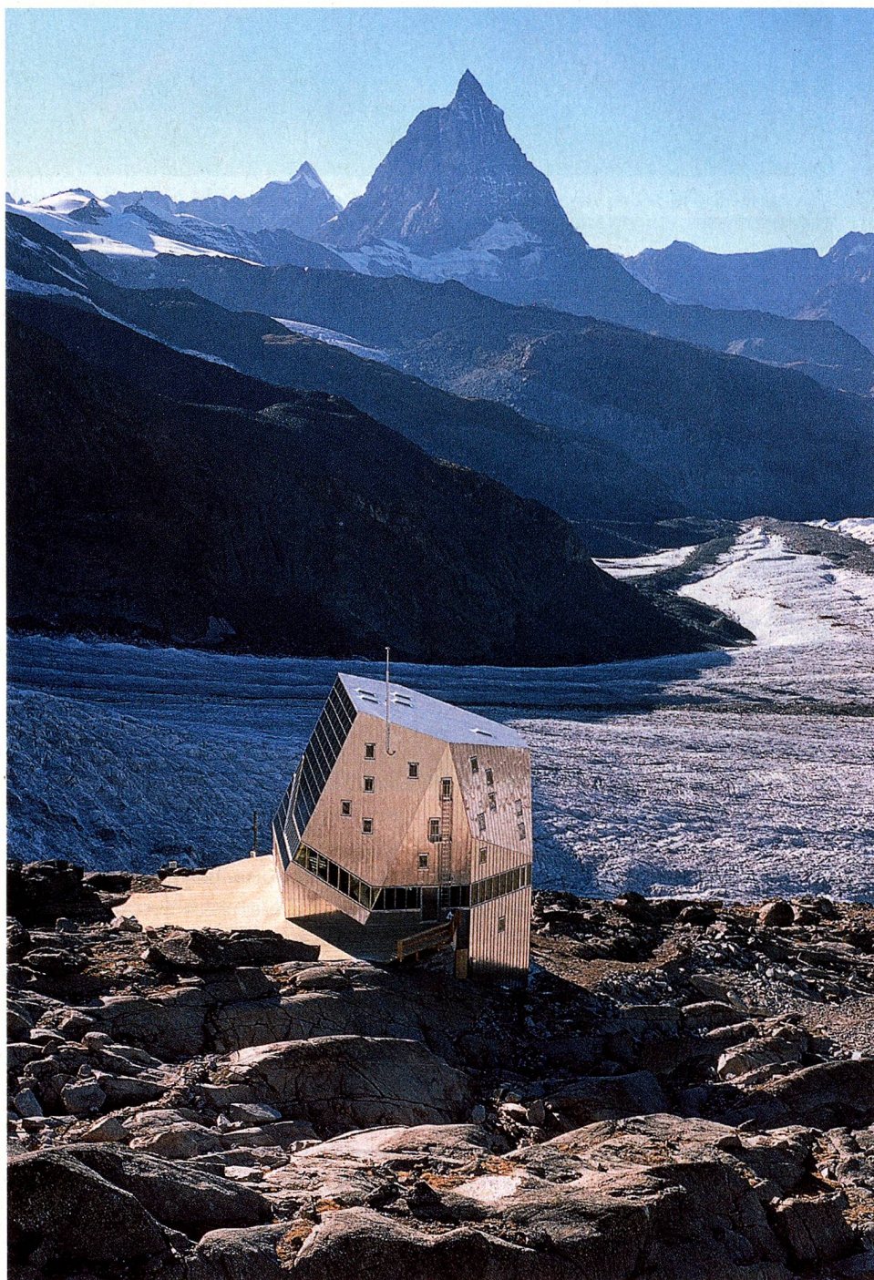
El Comité Central del CAS en 1893, la cabaña Monte-Rosa, inaugurada en 2009, la cabaña Dom con el Weisshorn, en torno al año 1900, y la cabaña Krönten, en la región del Gotardo

A mediados del siglo XIX, la montaña y la alta montaña aún guardaban innumerables enigmas. También fue la era dorada del alpinismo (1855-1865), que verá coronadas las más altas cumbres europeas y helvéticas, generalmente por estrellas británicas. Nace un fuerte impulso patriótico y científico capitaneado por el geólogo Rudolf Theodor Simler, que temía que los suizos desearan de informarse sobre los Alpes tendrían que recabar información en publicaciones inglesas. «Una situación semejante nos resultaría penosa, vergonzosa». En este contexto, el Club Alpino Suizo fue fundado el 19 de abril de 1863 en la cantina