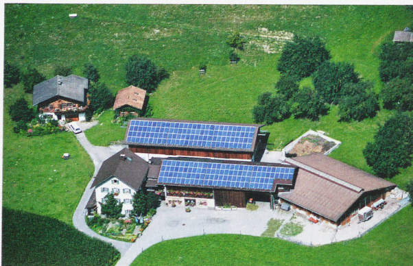
Imágenes futuristas: Placas solares en los tejados de Schiers (Los Grisones), paisaje con turbinas eólicas en el sur de Alemania y fachadas de edificios antiguos revestidas ahora con colectores, como en los edificios Sihlweid de Zürich

contradice su afán proteccionista. Los más radicales de sus filas reivindican únicamente el ahorro en el consumo a la hora de aplicar la transición energética.