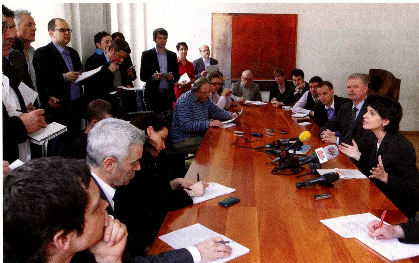
14 de marzo de 2011: en el Palacio Federal, la consejera federal Doris Leuthard explica a representantes de los medios los planes del Gobierno para la transición energética

Tras un tiempo invernal frío y húmedo que parecía interminable, a finales de mayo el sol se hizo sentir en Suiza, por fin. Pero apenas vimos los primeros rayos, se encapotó el cielo del Palacio Federal en Berna: en junio se celebraron debates acalorados en el Consejo Nacional sobre la duración de operatividad de las centrales nucleares suizas. ¿Deberían seguir funcionando indefinidamente todas ellas, ya bastante anticuadas, si se invierte continuamente en su seguridad? ¿O hace falta que las autoridades fijen una fecha de caducidad, es decir, una fecha para desactivarlas?