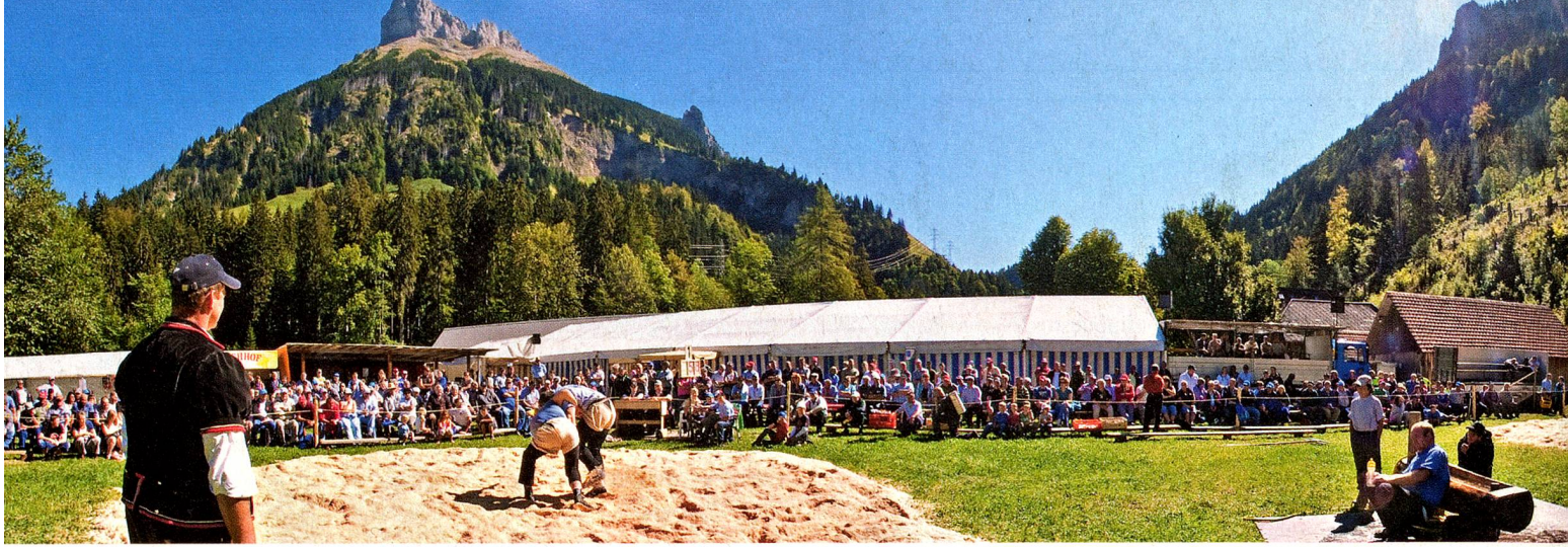
La lucha suiza, Kemmeribodenbad, Región de Berna