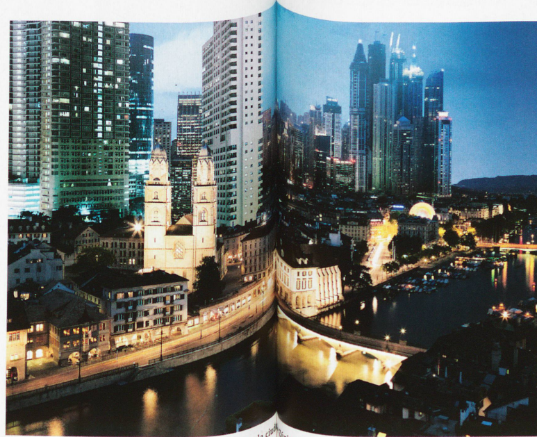
Panorama previsto por los críticos de la inmigración para la ciudad de Eibach

No obstante, así no se arreglan los problemas mencionados. Entretanto, la UDC no es ni por asomo el único partido que ha incluido en su orden del día la inmigración. También los socialdemócratas se percatan de los temores de la población. Por eso presentaron en 2012 un escrito sobre la inmigración. Y si bien no quieren rescindir inmediatamente el acuerdo de la libre circulación de personas, como la UDC, su receta reza: ampliación de las medidas complementarias contra las presiones salariales y los alquileres elevados, y consideran que la «desacertada política fiscal conservadora y de emplazamiento» es un gran error. El PS critica que Suiza, «con las tasas más bajas de impuestos de todos los países estructuralmente fuertes, atrae a empresas internacionales, aunque no dispone en absoluto de suficiente personal cualificado». Como consecuencia de esto, se produce una oleada de mano de obra extranjera que acude a los focos de la economía suiza ya de por sí recalentados. Y opina que los beneficiados son casi exclusivamente los consorcios, mientras que el ciudadano de a