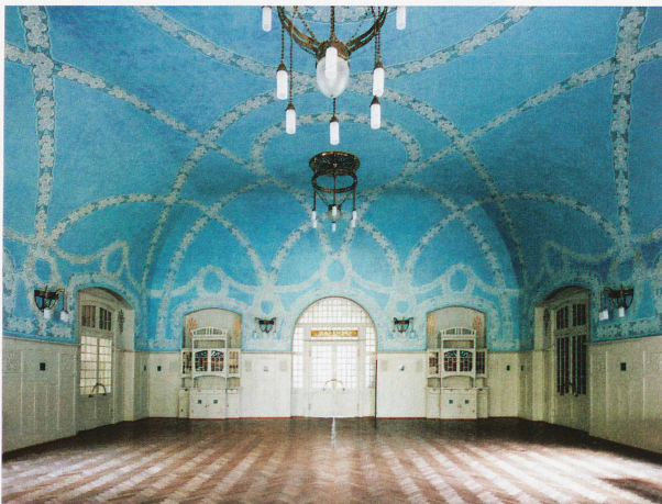
Comedor y sala de baile del balneario de Bergün, inaugurado en 1906, fotografiados en 2009 por Ralph Feiner

La exposición estará abierta hasta el 12 de mayo de 2013 en el Museo de Arte de Los Grisones, Coira. www.buendner-kunstmuseum.ch El libro: „Ansichtssache“, 150 Jahre Architektur- und Fotografie in Graubünden (Una cuestión de perspectivas, 150 años de fotografía arquitectónica), en alemán, editado por Stephan Kunz y Kôbi Gantenbein; Editorial Scheidegger & Spiess / Museo de Arte de Los Grisones, 384 páginas; CHF 58.-, Euro 48.-