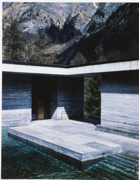
El nuevo edificio de las Thérme Vals, del arquitecto Peter Zumthor, inaugurado en 1996 y fotografiado por Hélène Binet