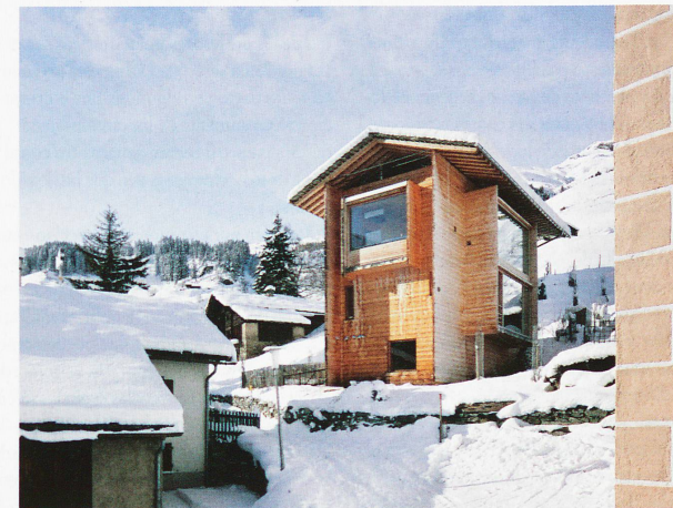
La casa de Leis, del arquitecto Peter Zumthor, fotografiada en 2012 por Ralph Feiner