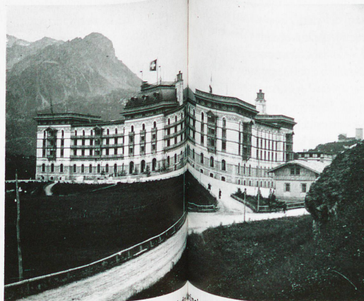
El „Hôtel Kursaal de la Maloja“ fotografiado a principios del siglo XX por Rudolf Zinggeler