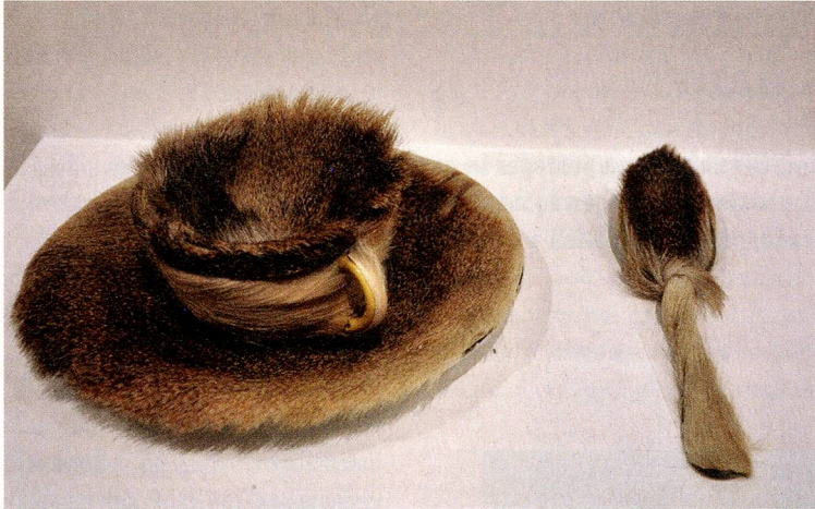
«Taza forrada de piel», de 1923