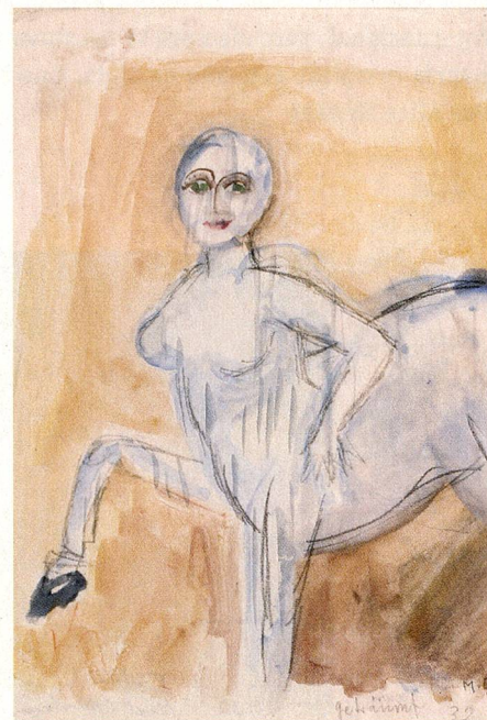
«Centaura en el fondo del mar», de 1932