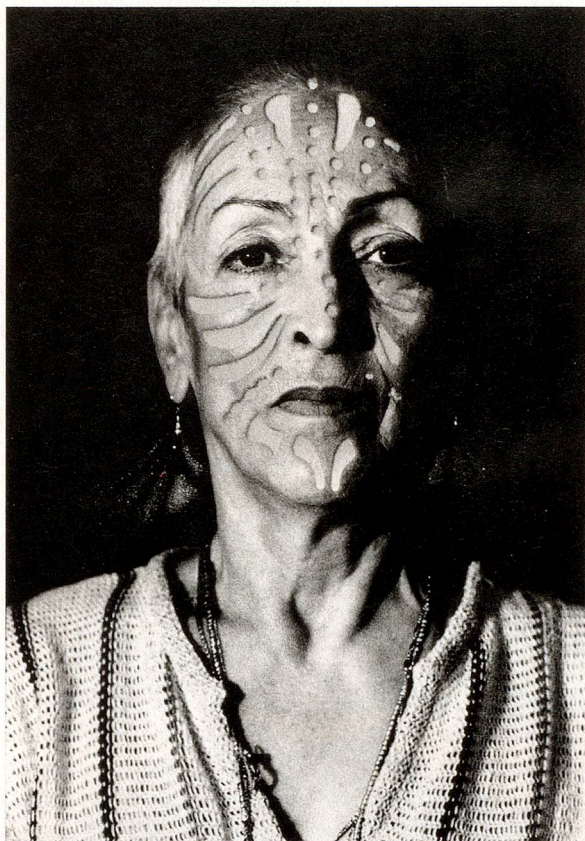
La famosa obra de Oppenheim «Retrato con tatuaje», de 1980