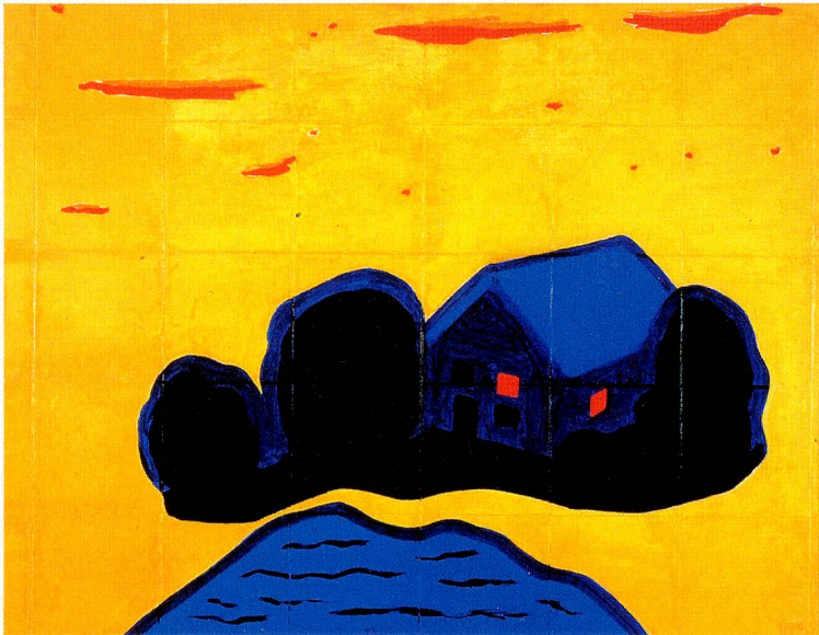
«Una tarde de 1910», de 1972

tupida cola de piel, parodia a la famosa taza forrada de piel. En „Retrato con tatuaje“ (1980) rocía con pintura su retrato con un patrón estereotipado, reclamando así la soberanía sobre su propia imagen. Repetidas veces se ocupa de las nubes, ese fenómeno celeste, vaporoso y efímero, en las que la imaginación humana construye etéreas fantasías desde hace siglos. Meret Oppenheim configura nubes de agudos perfiles en óleo sobre un lienzo, como un dibujo a pluma o en el bonito e impecadero bronce: „Seis nubes sobre un puente“ (1975). El tema de la feminidad lo continúa en objetos como los „guantes“ bordados con venas (1985).