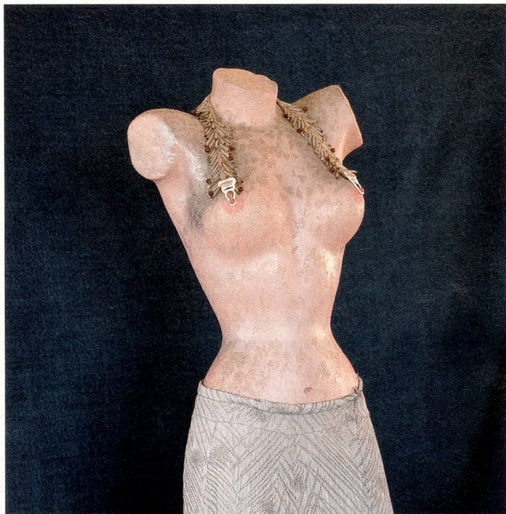
«Traje de noche con collar-sujetador», de 1968