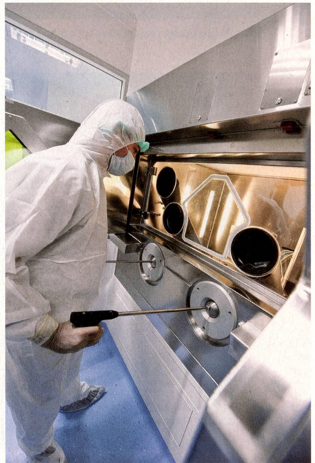
La medicina ultramoderna de alta tecnología origina enormes gastos

El bloqueo de la política sanitaria obedece a varias razones. Una de ellas es que en un punto fundamental no se llega a un acuerdo: ¿Qué necesita el sistema sanitario? ¿Más mercado o más Estado? El Parlamento, predominantemente conservador, tiende a favorecer modelos competitivos, pero la población es escéptica. El fracaso del proyecto de ley Managed-Care el pasado junio es un claro ejemplo. Por el contrario, la iniciativa del PS para introducir un seguro de enfermedad unitario parece tener buenas posibilidades de ser aceptada por el pueblo. También aquí juegan un papel importante ciertas negligencias políticas: en los últimos años, la política no ha logrado introducir un equilibrio eficaz de ries-