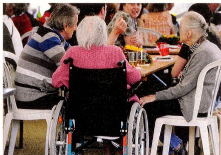
El porcentaje de ancianos en la población es cada vez mayor

des retos del futuro: atender al creciente número de enfermos crónicos y de personas que necesitan cuidados permanentes. La Asociación Suiza de Enfermos de Alzheimer