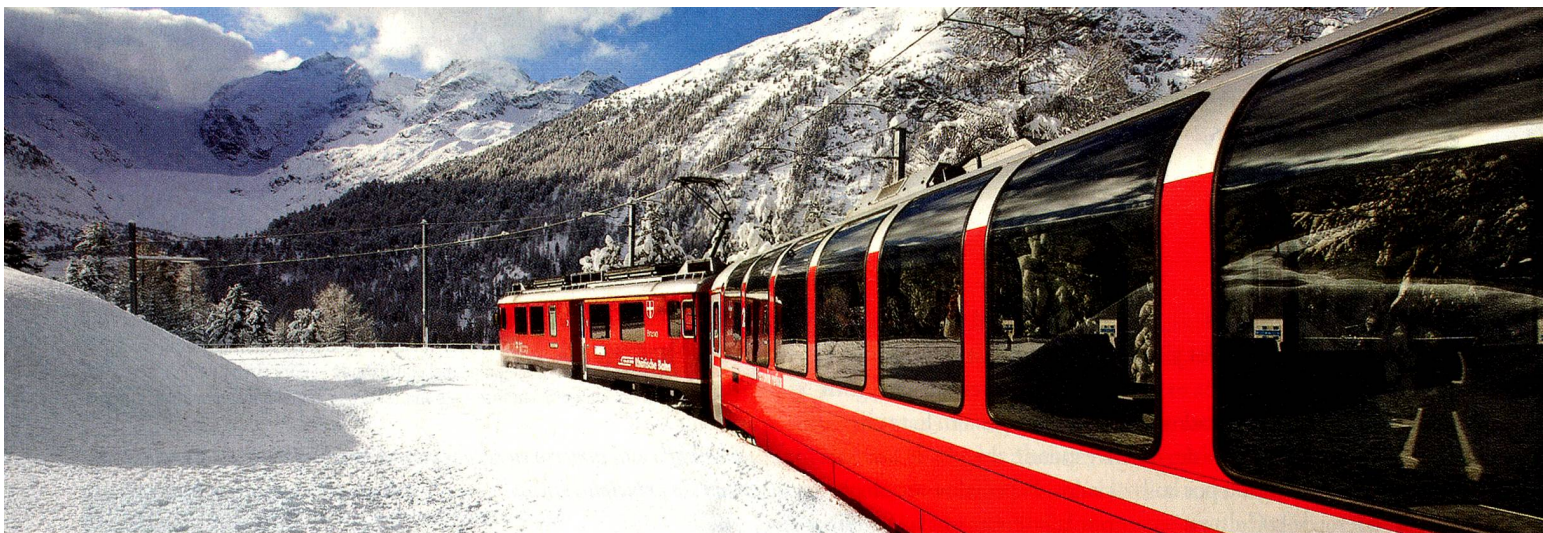
Bernina Express cerca del Lago Bianco, Grisones