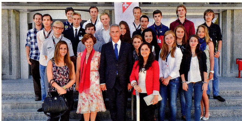
Arriba: Jóvenes suizos del extranjero junto con el consejero federal Didier Burkhalter y su esposa Friedrun durante el Congreso de los Suizos en el Extranjero en Lausanne Abajo: El equipo del campamento (Adventure-Camp) del año pasado